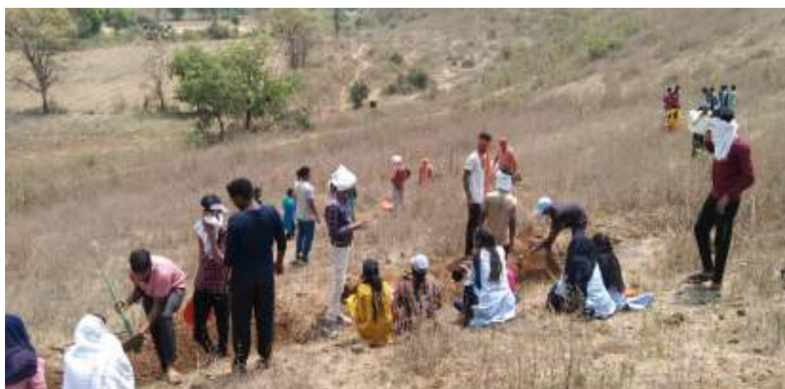
Photograph of Students Engage in Voluntary labor, date 28/03/2022