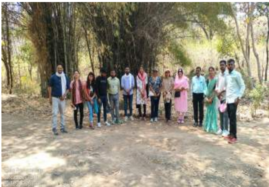
Photographs of Dnyanganga Wildlife Sanctuary, date 26/03/2024