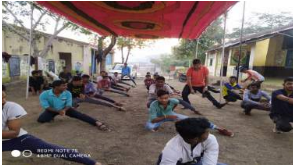
Photograph of Self-defense Karate Program, date 03/02/2020