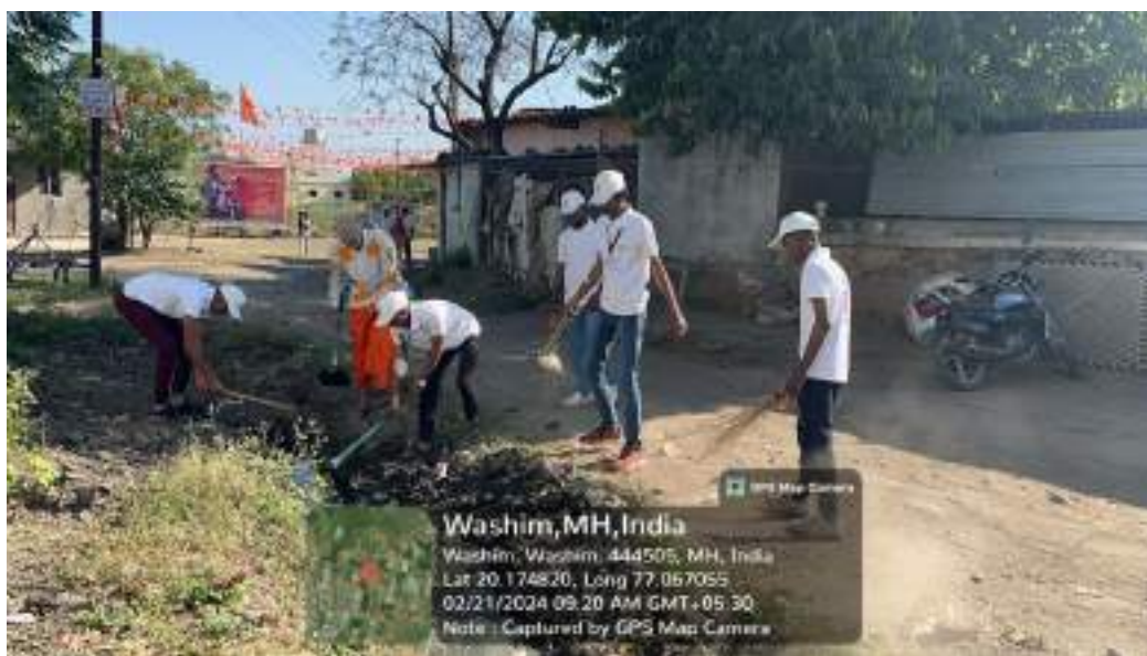
Photograph of Village Cleanliness Program, date 21/02/2024