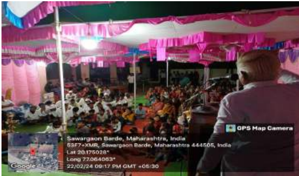
Photograph of Defecation Program, date 21/02/2024