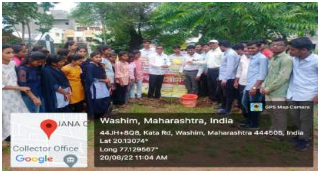
Photograph of Participation of the principle of the college, teachers and the students in Tree Plantation, date 20/08/2022