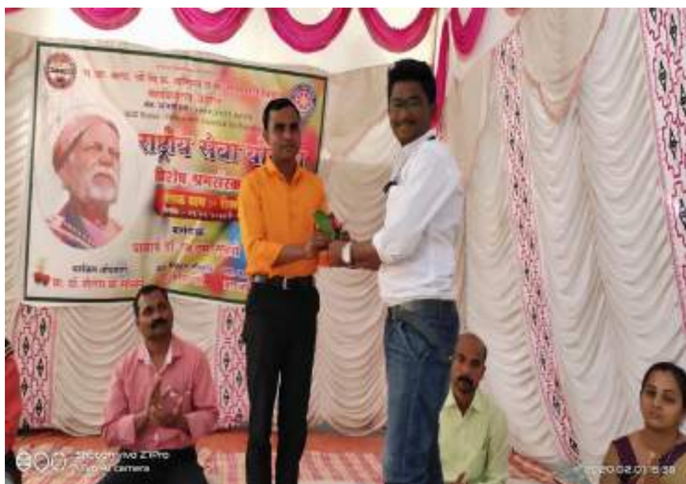
Photograph of Water literacy program, date 01/02/2020