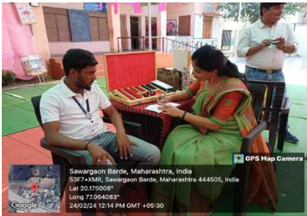
Photograph of Eye-check camp, date 24/02/2024