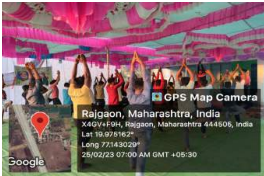
Photograph of Program on Yogasan, date 25/02/2023