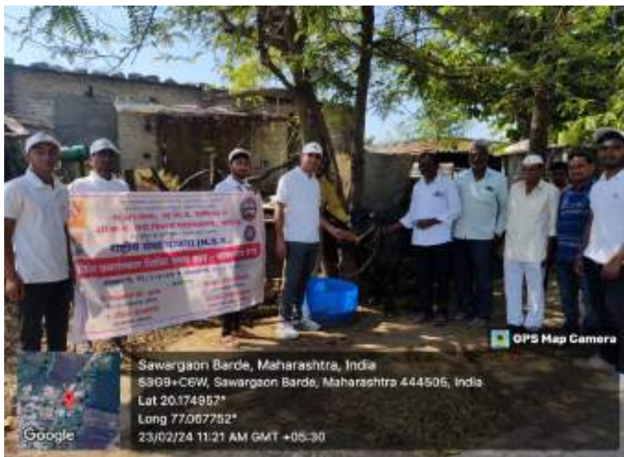
Photograph of Veterinary Diagnosis Camp, date 23/02/2024