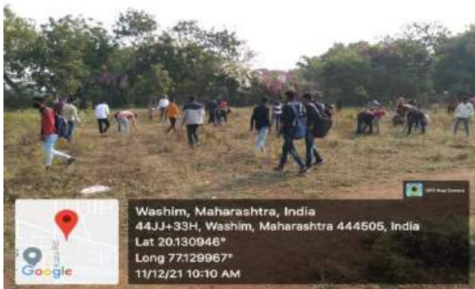
Photograph of Cleanliness Campaign, date 11/12/2021