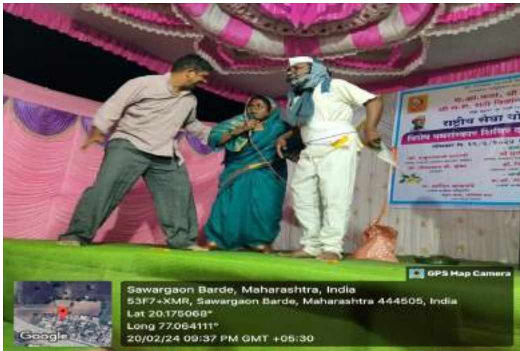
Photograph of Cultural Program 'Nirbhaya Lagali Ludhayala', date 20/02/2024