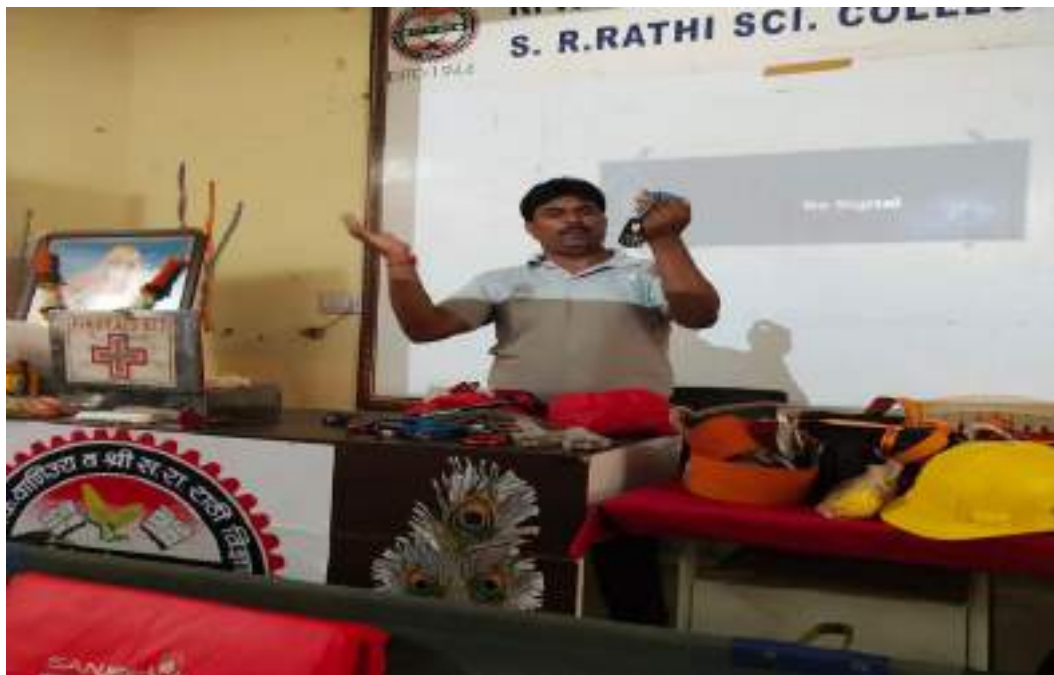
Photograph of Disaster Relief Day, date 13/10/ 2019