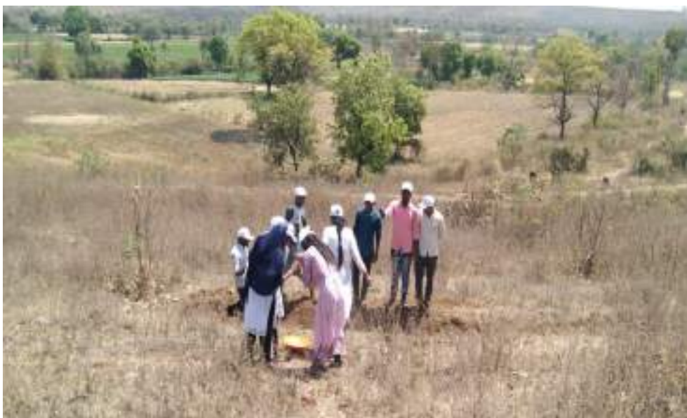
Photograph of Students Engage in Voluntary labor, date 28/03/2022