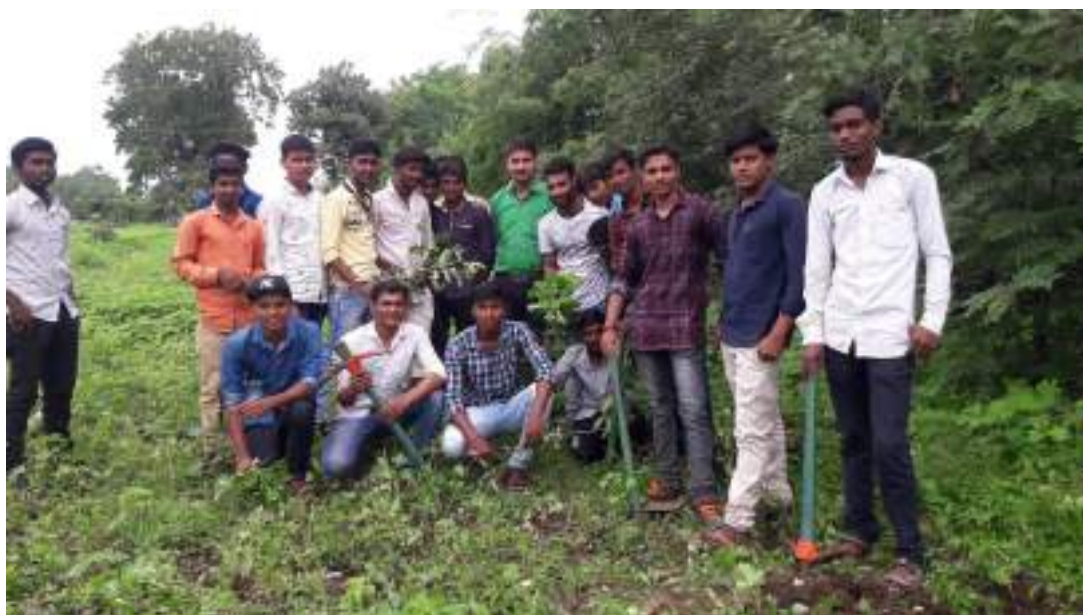
Photograph of Clean Environment Day, date 20/08/2019