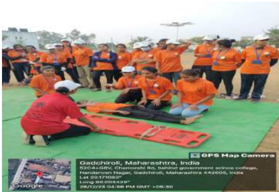
Photograph of Disaster management Workshop, date 25/12/2023