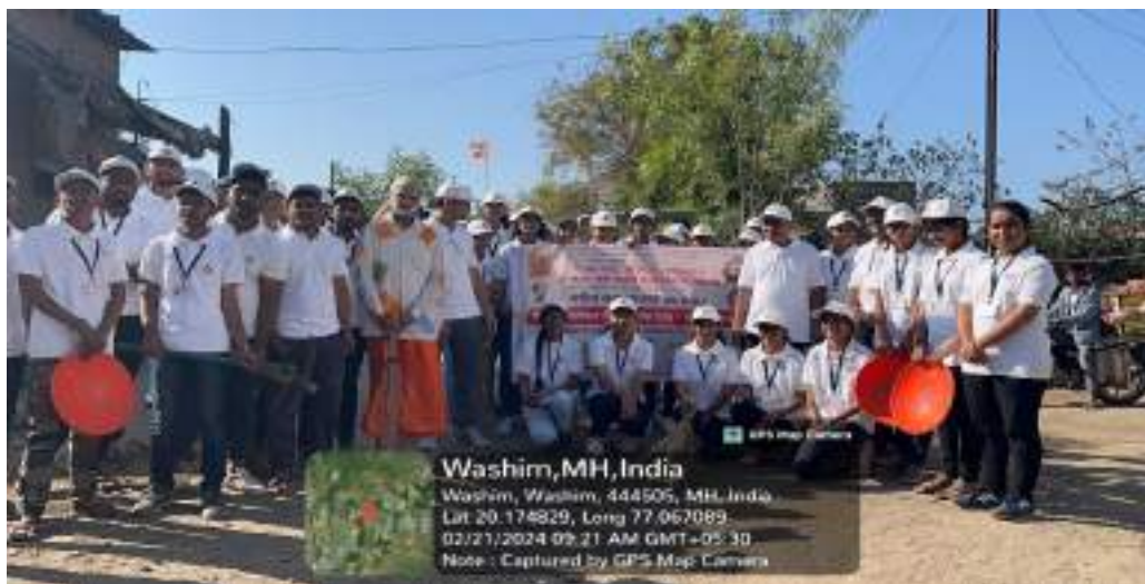
Photograph of Village Cleanliness Program, date 21/02/2024