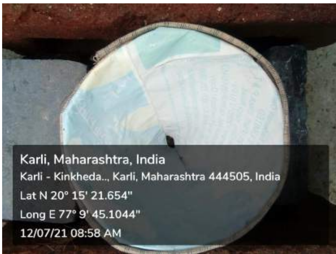
Photograph of Rainfall Measurement activity, date 12/07/2021