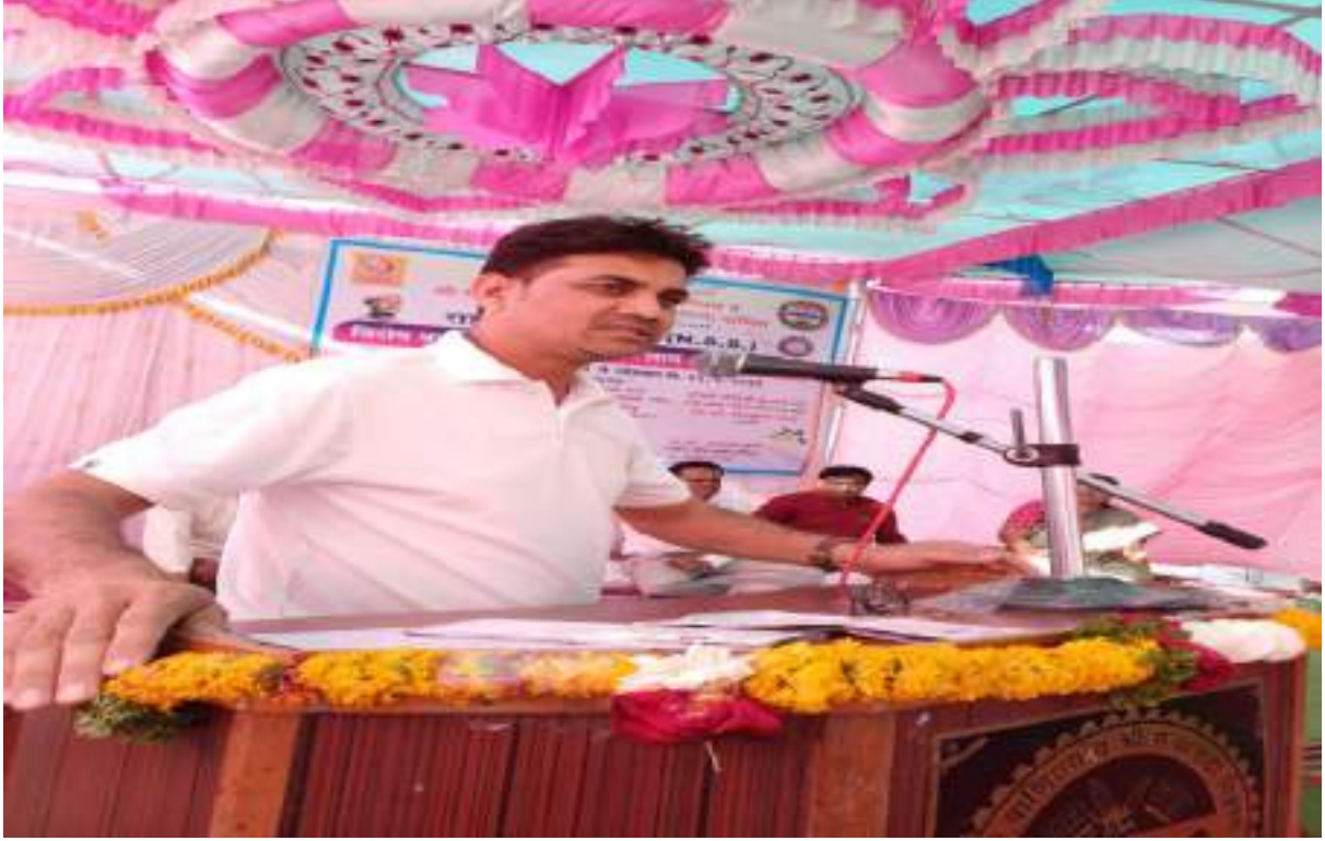
Photograph of Disaster Management Program, date 21/02/2024

News of Disaster Management, date 24/02/2024