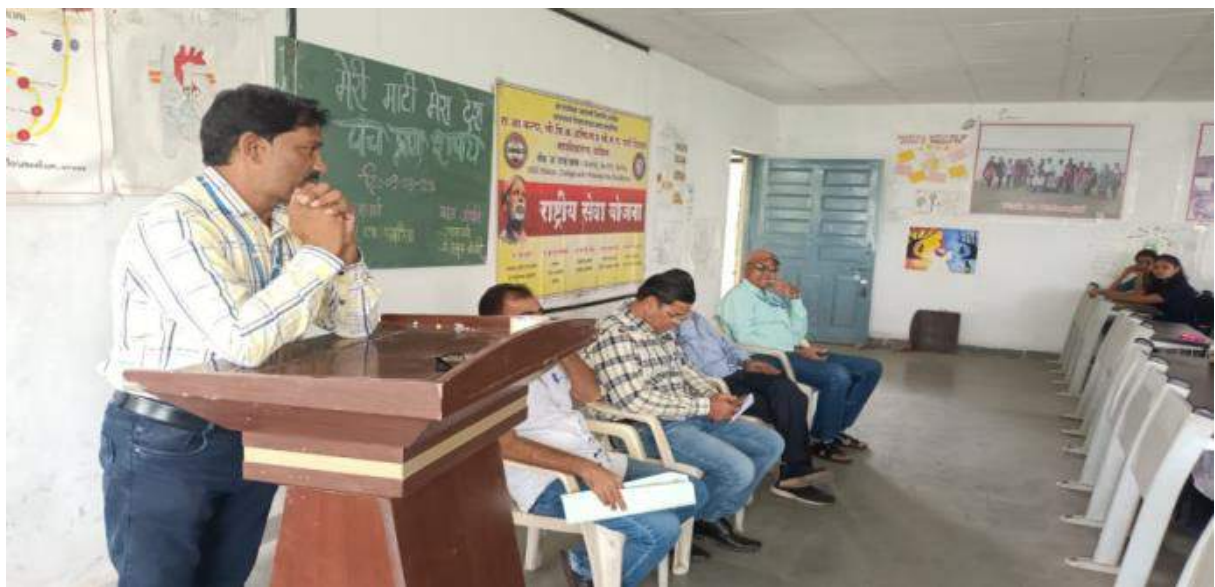
Photograph of "Meri Mati Mera Desh" program, date 09/08/2023