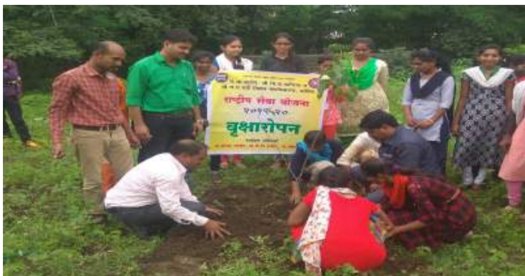
Photograph of Tree Plantation, date 14/08/2019