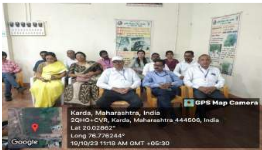
Photograph of KVK Karda Field Visit Program, date 19/10/2023