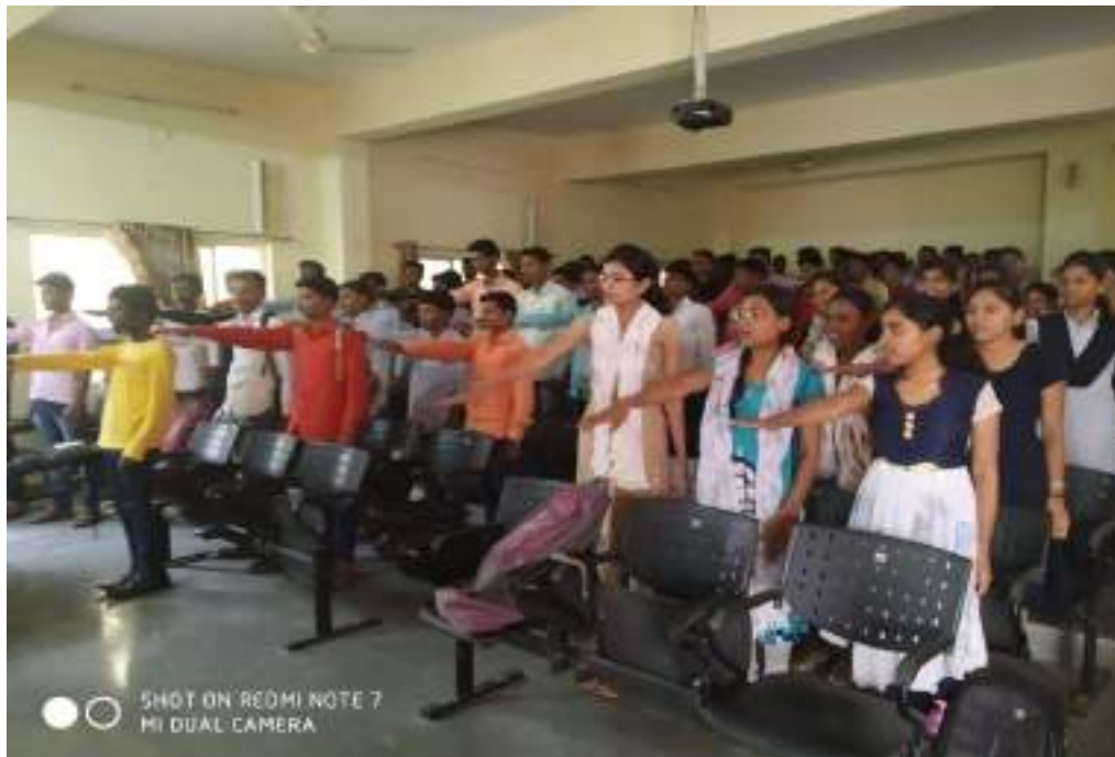
Photograph of Tobacco Adiction Program, dated 19/7/2019