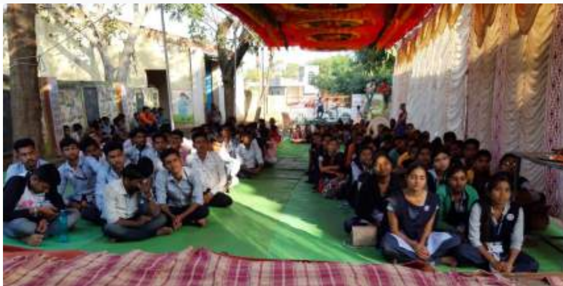
Photograph of Health-Checkup Camp date 08/01/2020