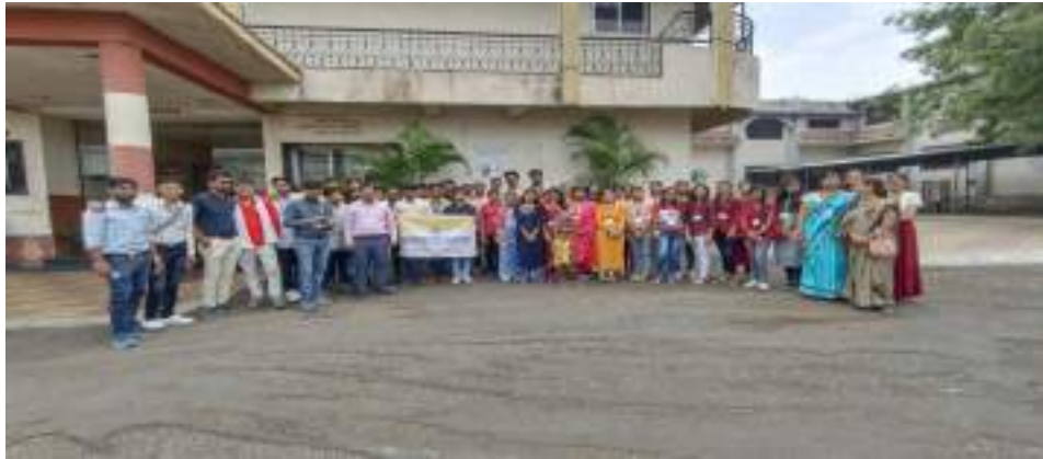
Photograph of Visit to Parle Factory, Khamgaon, date 08/04//2023