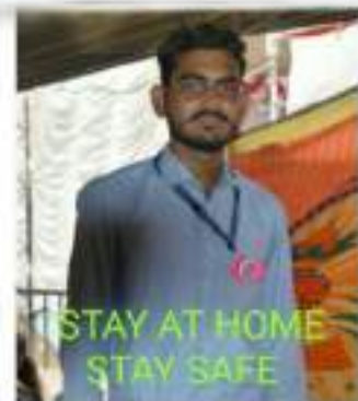
Photograph of Corona Epidemic Awareness, date 20/05/2020