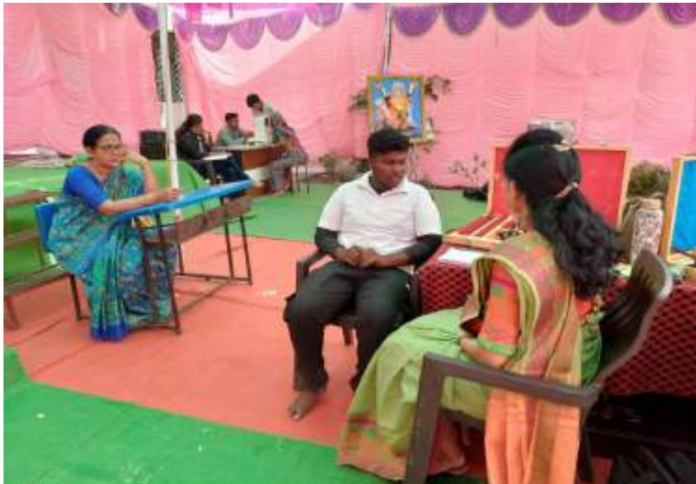
Photograph of Eye-check camp, date 24/02/2024