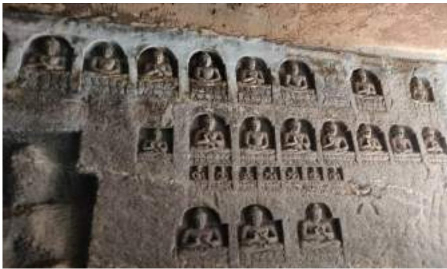
Photograph of Ajantha Caves, date 26/03/2024