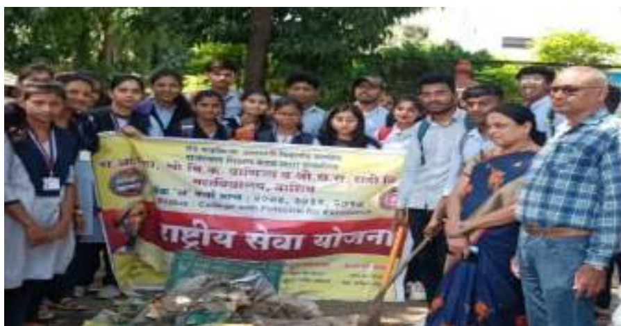
Photograph of Plastic-Free India Campaign, date 15/10/2022