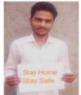
Photograph of Corona Epidemic Awareness, date 20/05/2020