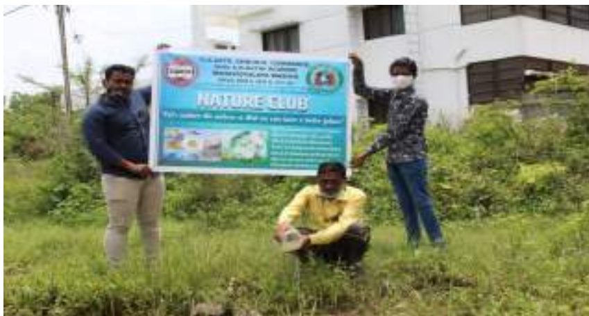
Photograph of Release of Guppy Fishes in the ponds near the Collector's Office, date 28/08/2021