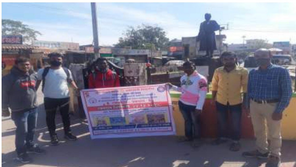
Photograph of Blood Donation camp, date 24/11/2020