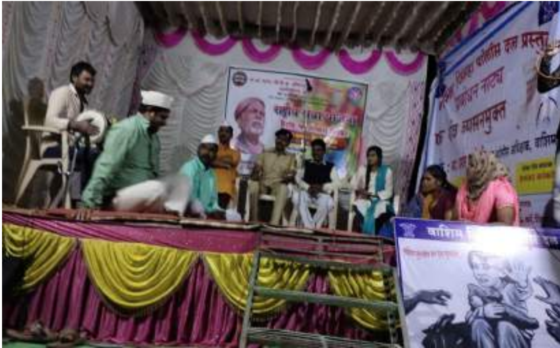
Photograph of Cultural program, date 04/02/2020