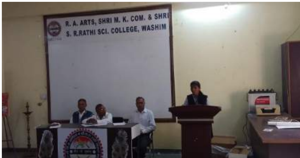
Photograph of National Voter's Day, date 25/01/2020