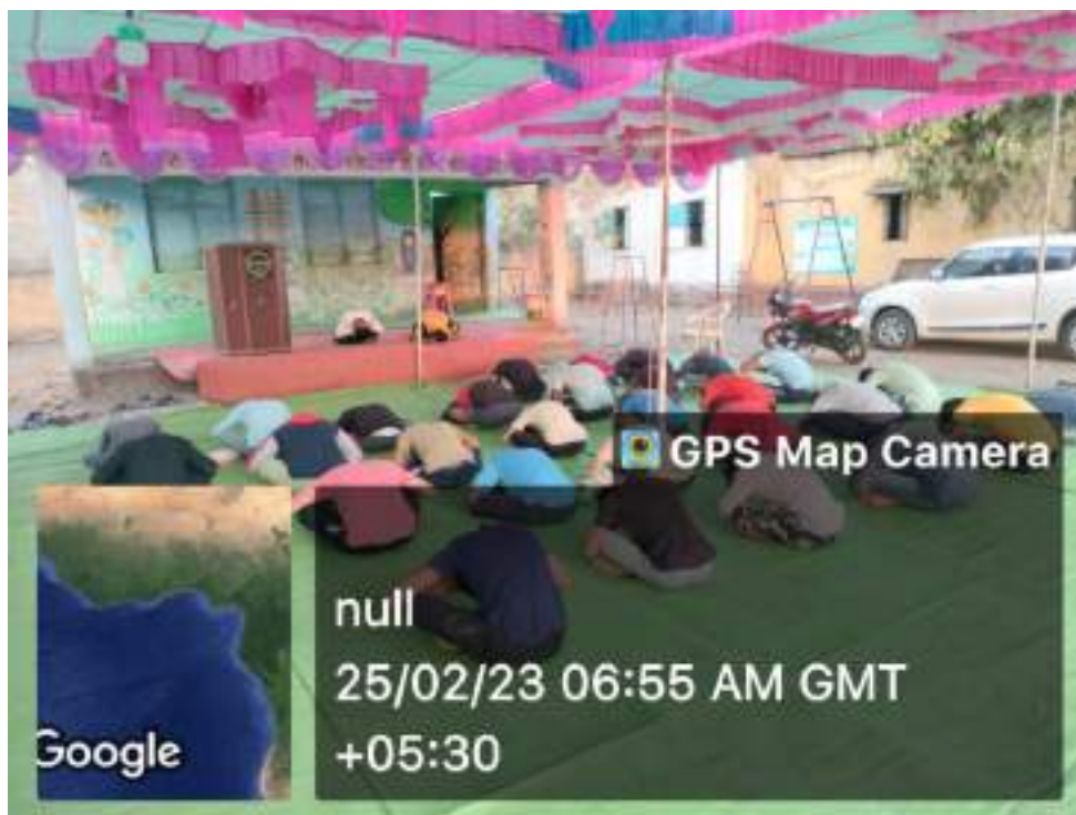
Photograph of Program on Yogasan, date 25/02/2023