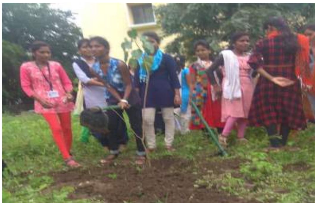
Photograph of Clean Environment Day, date 20/08/2019