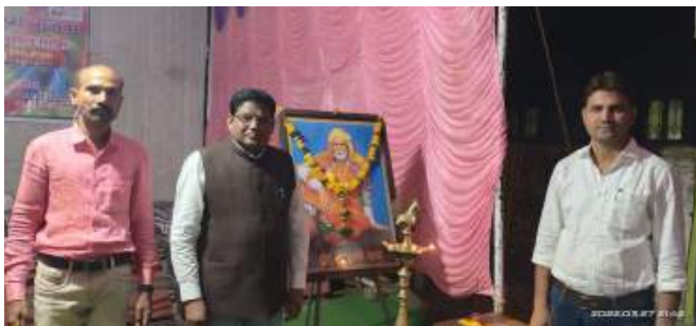
Photograph of Eradicating Superstition, date 30/03/2022