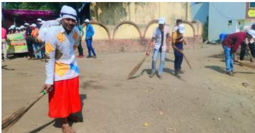
Photograph of clean-up drive, date 30/03/2022