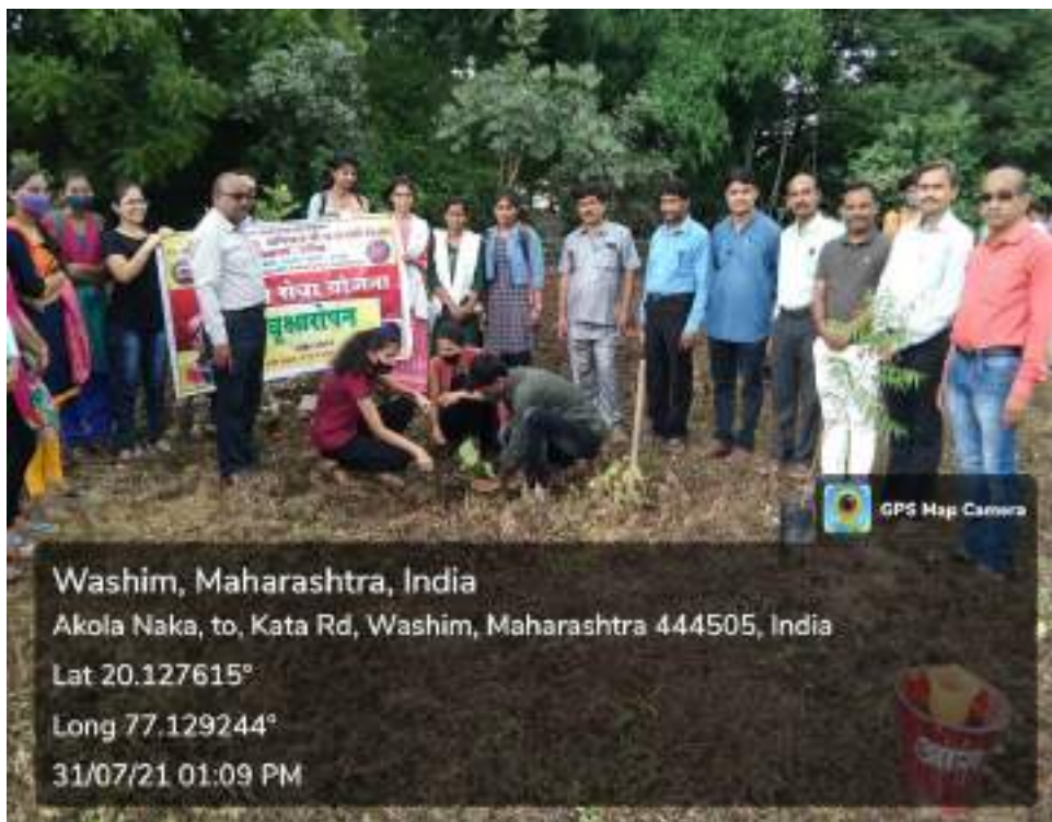
Photograph of Tree plantation Program, date 31/07/2021