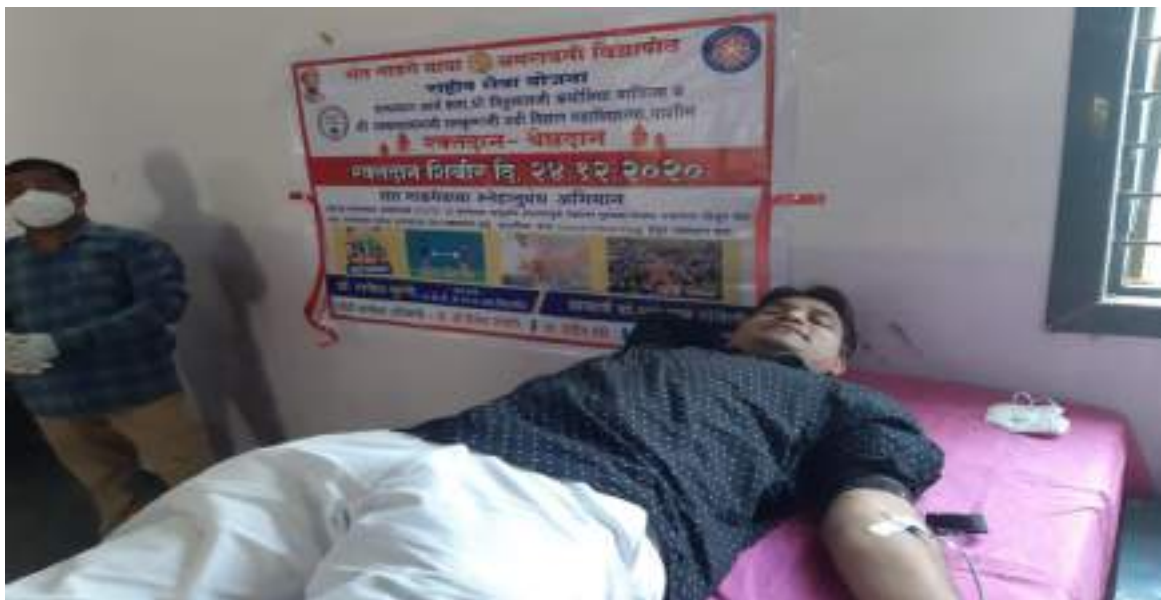
Photograph of Blood Donation camp, date 24/11/2020