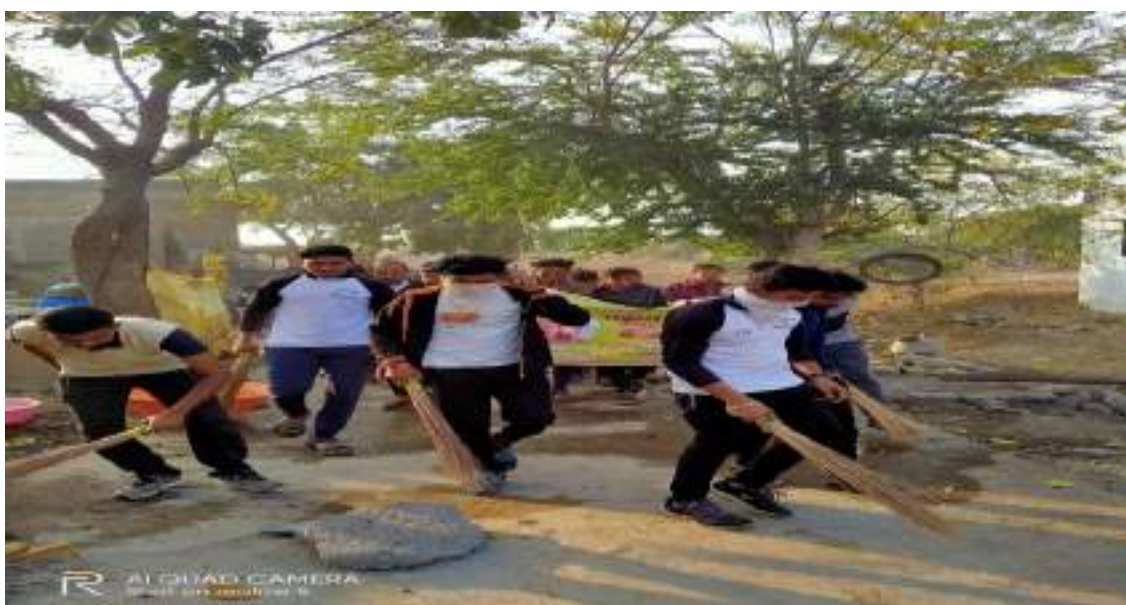
Photograph of Cleaning and drainage camp,date 31/01/ 2020