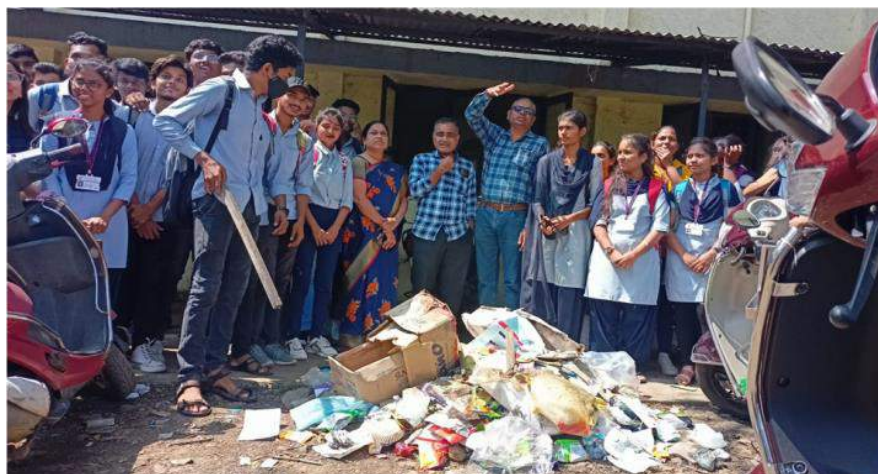
Photograph of Plastic-Free India Campaign, date 15/10/2022