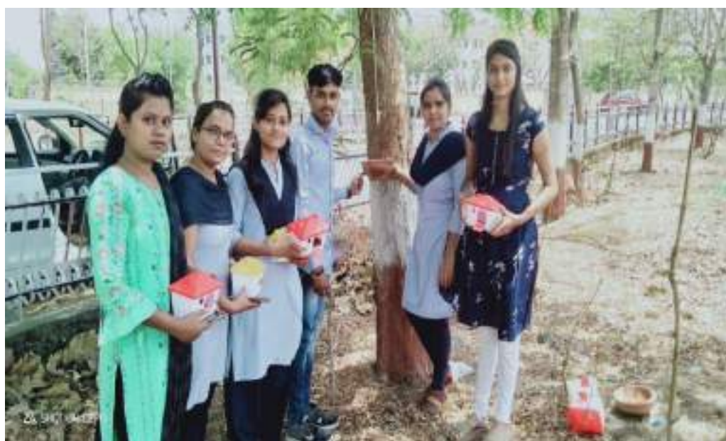
Photograph of Installation of Nests and Water Pots for Bird