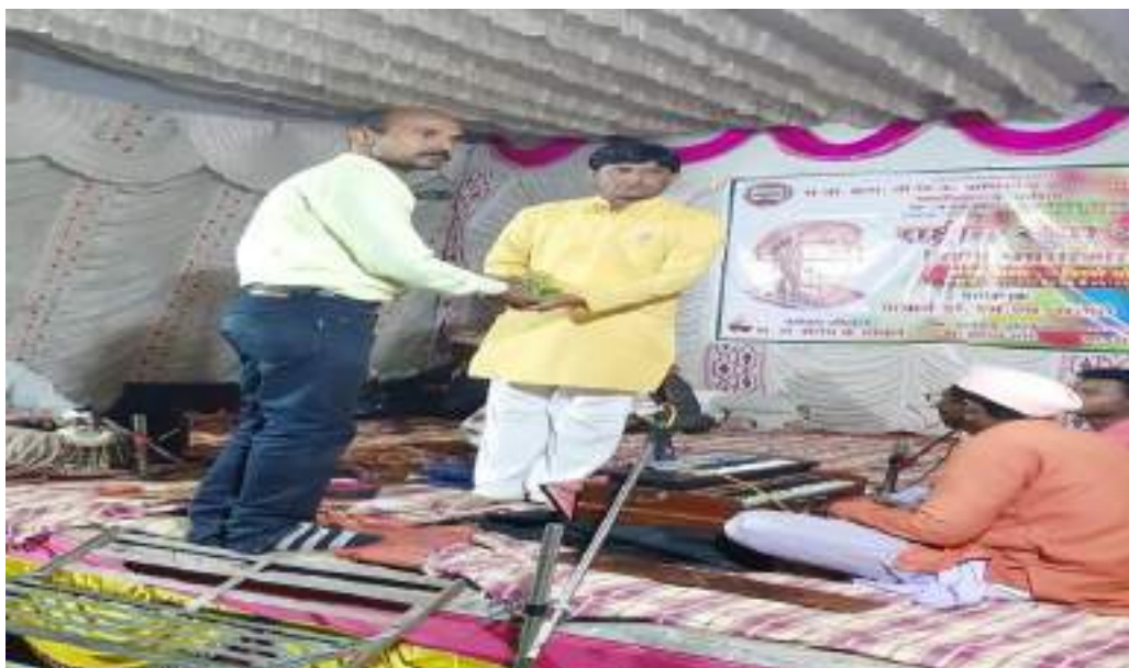
Photograph of Village open defecation free On Monday, 03/02/,2020