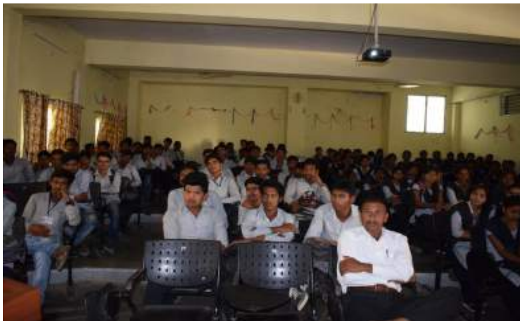
Photograph of Disaster Relief Day, date 13/10/ 2019