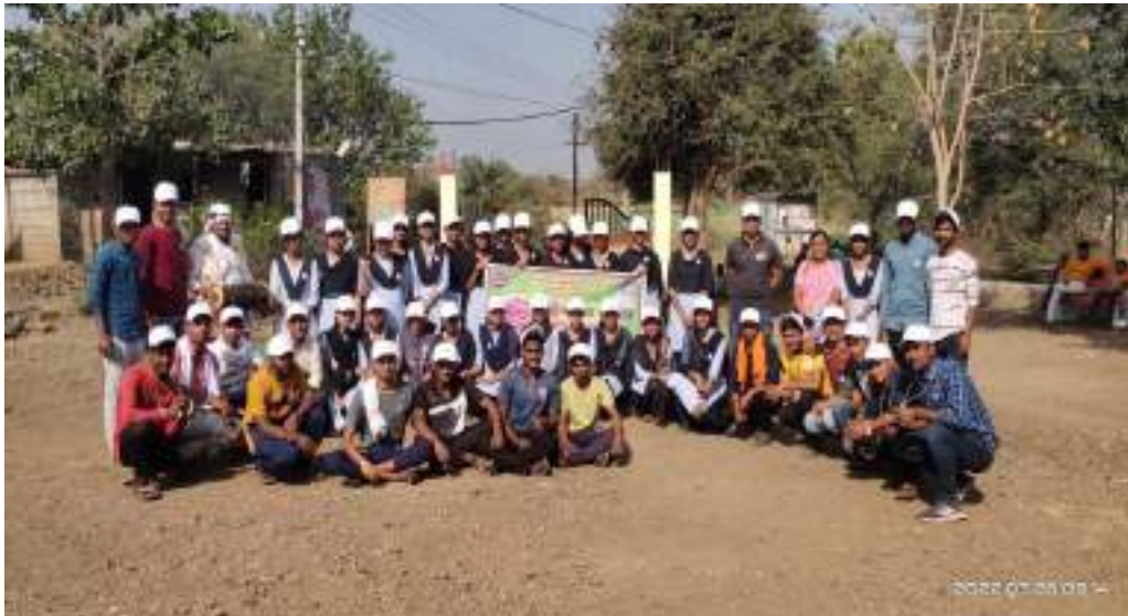
Photograph of clean-up drive, date 30/03/2022