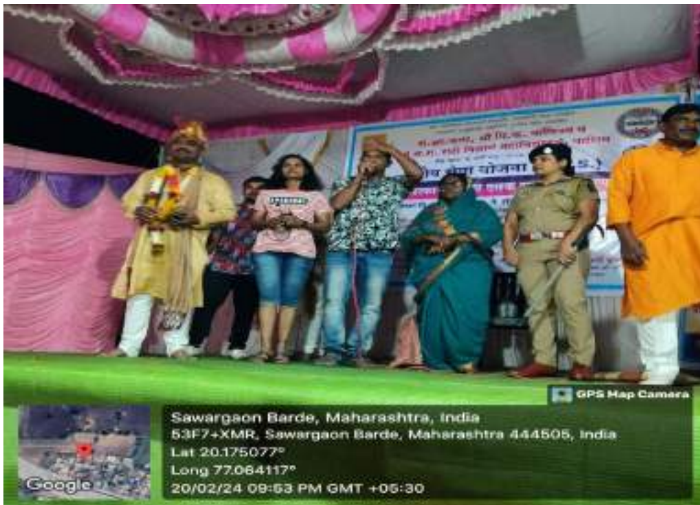
Photograph of Cultural Program 'Nirbhaya Lagali Ludhayala', date 20/02/2024