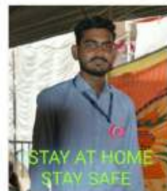
Photograph of Corona Epidemic Awareness, date 20/05/2020