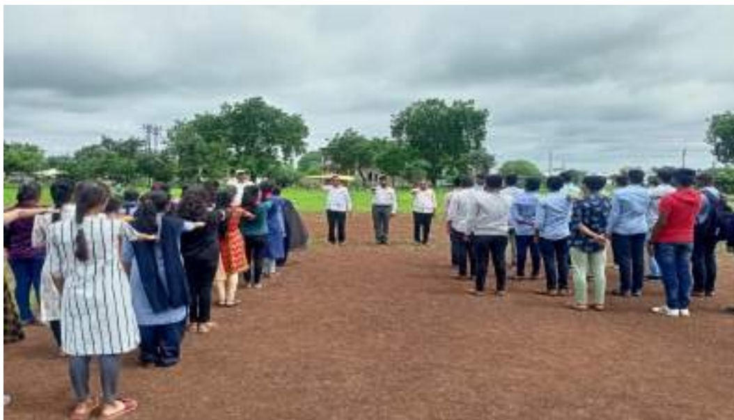
Photograph of National Voter's Day Celebration, date 25/01/2022