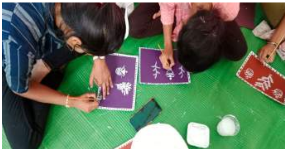
Photograph of Warli Art Workshop, date 27/03/2022