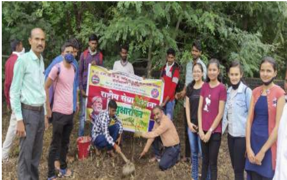
Photograph of Tree plantation Program, date 31/07/2021