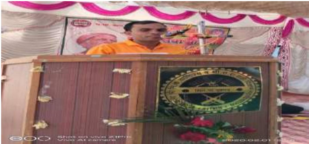
Photographs of Water literacy program, date 01/02/2020