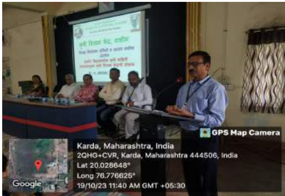
Photograph of KVK Karda Field Visit Program, date 19/10/2023