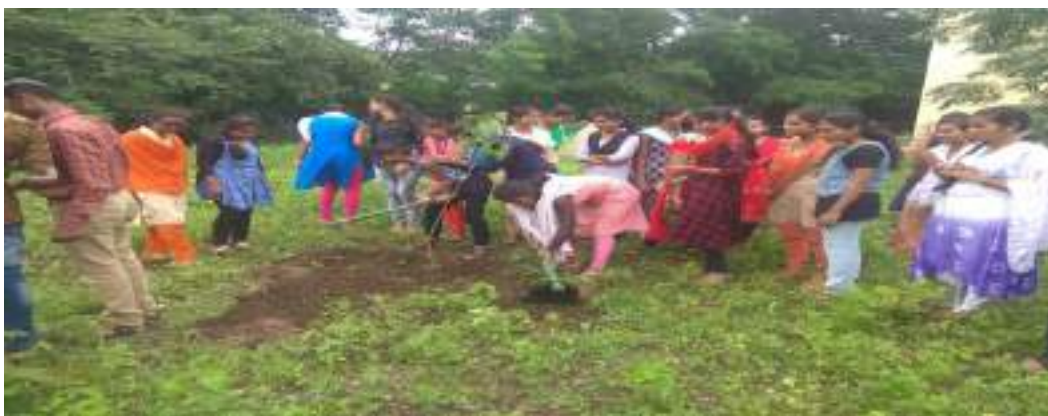
Photograph of Tree Plantation, date 14/08/2019