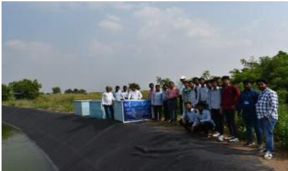
Photograph of KVK Karda Field Visit Program, date 19/10/2023