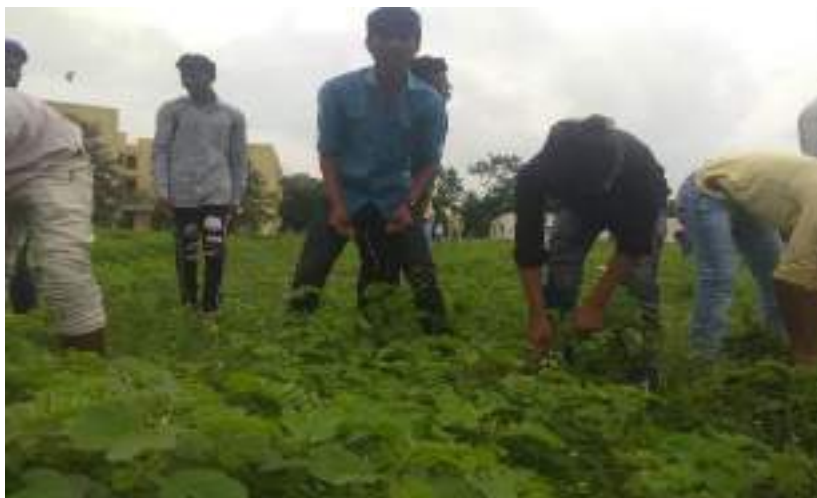
Photograph of Eradication of Parthenium, date 22/08/2021