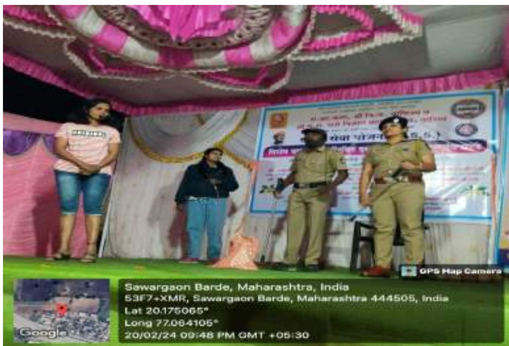
Photograph of Cultural Program 'Nirbhaya Lagali Ludhayala', date 20/02/2024