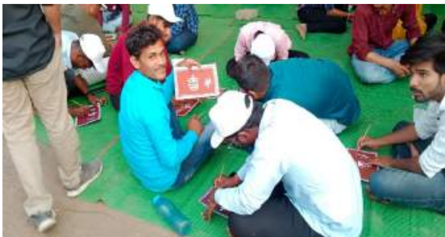
Photograph of Warli Art Workshop, date 27/03/2022