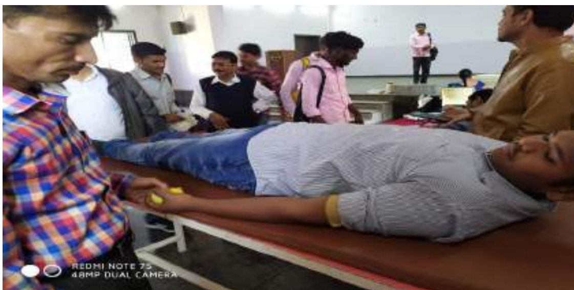
Photograph of Blood Donation Camp, date 29/09/2019