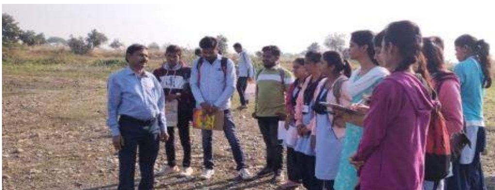
Photograph of Bird watching, date 25/01/2020