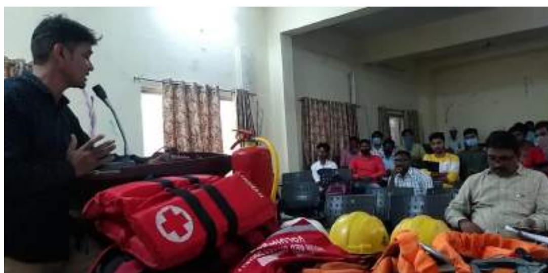
Photograph of Disaster Relief Day, date 13/10/ 2019