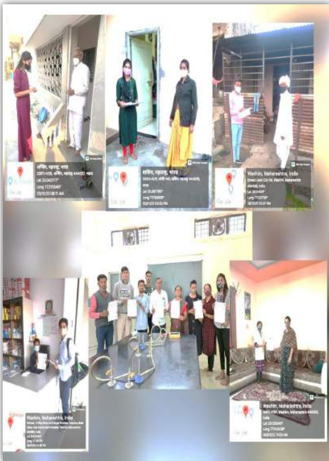
Photograph of Students giving information about Omicron, date 18/12/2021 to 17/01/2022