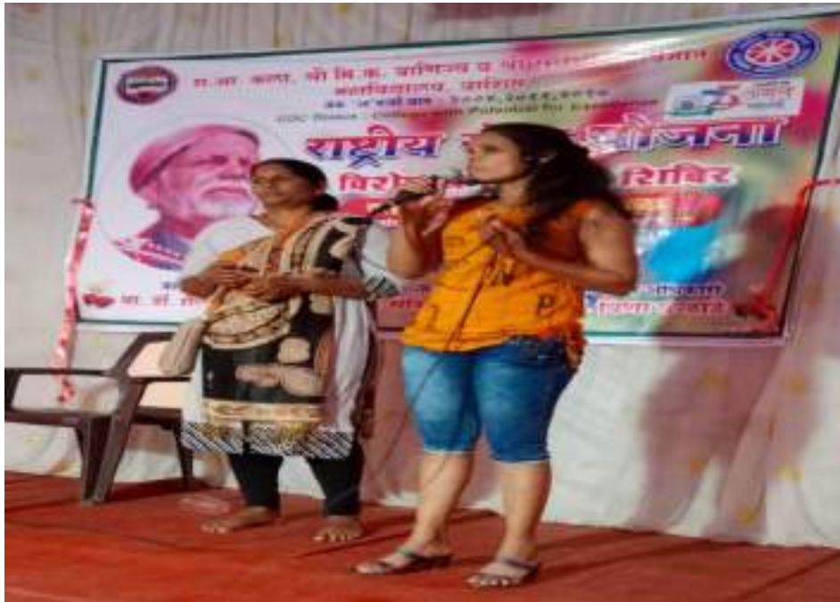
Photograph of Eradication of Supersition, date 28/03/2022