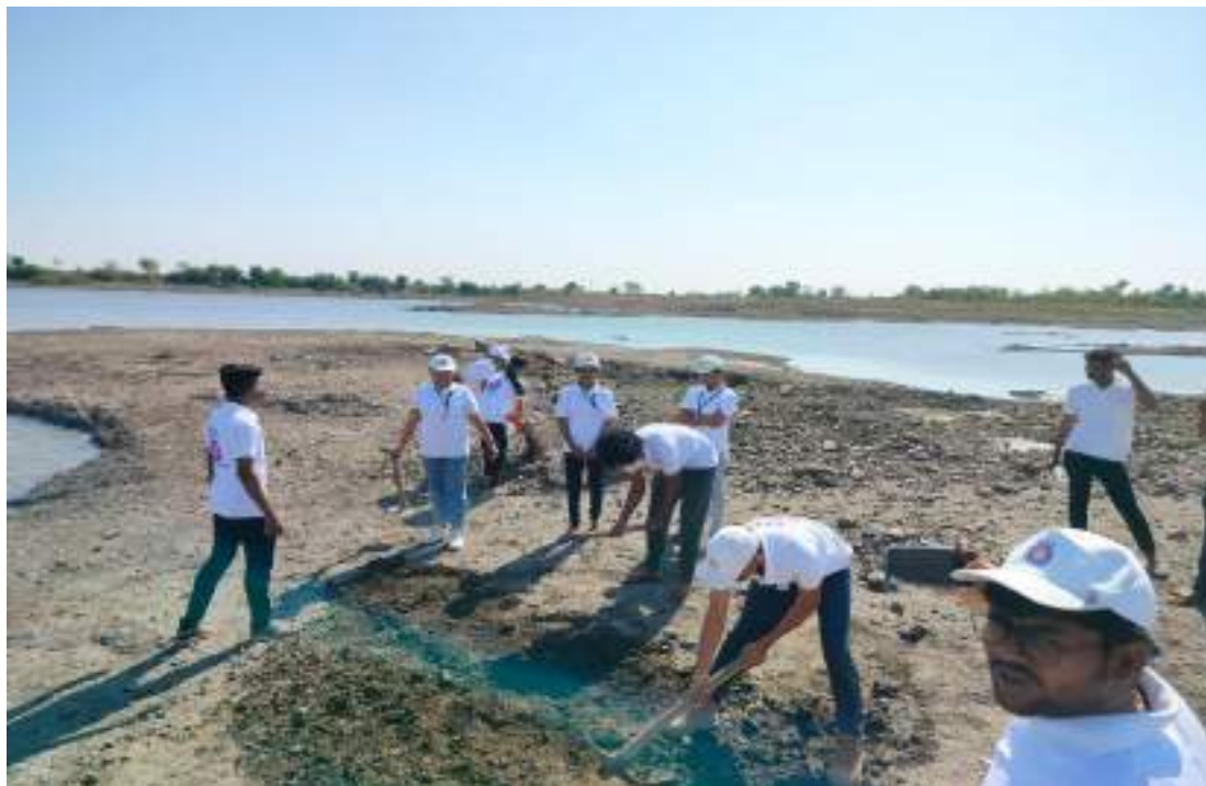
Photograph of Pond Deepening and Strengthening Project, date 21/02/2024