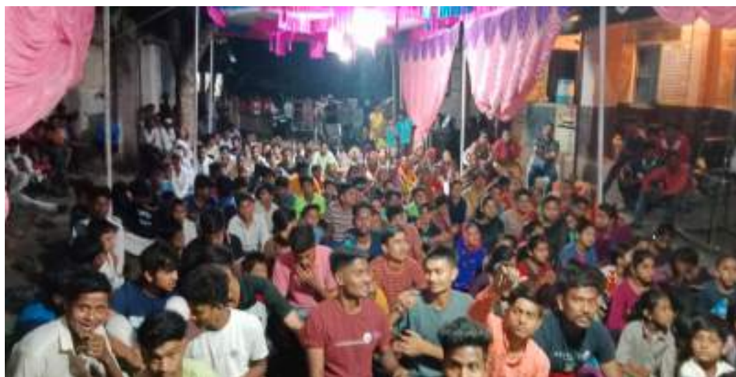
Photograph of Youth Dialogue skills, date 30/03/2022