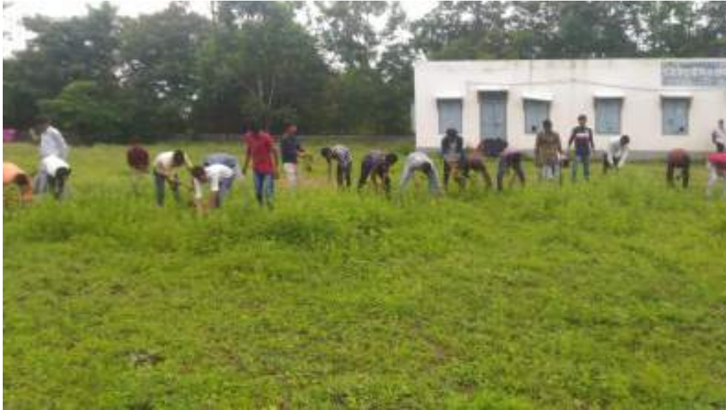
Photograph of Parthenium Hysterophorus , date 12/08/2020