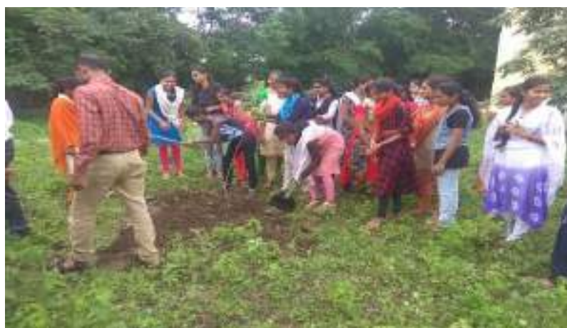
Photograph of Eradication of Parthenium, date 22/08/2021