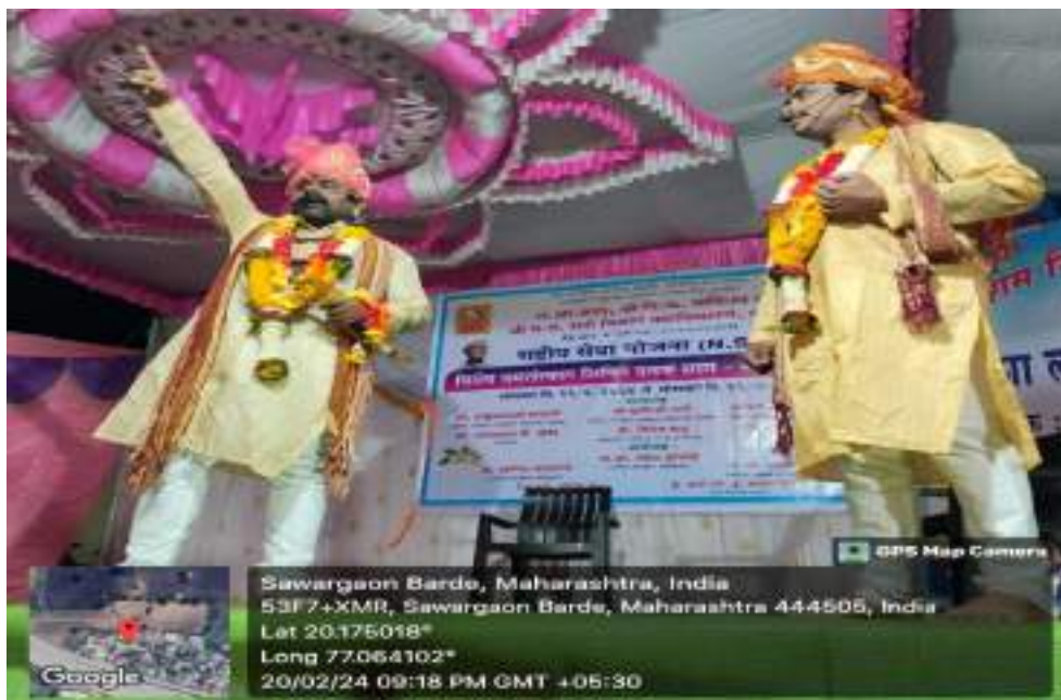
Photograph of Cultural Program 'Nirbhaya Lagali Ludhayala', date 20/02/2024