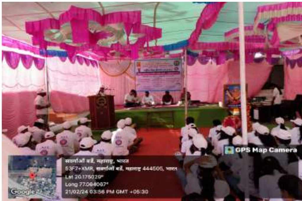
Photograph of Disaster Management Program, date 21/02/2024