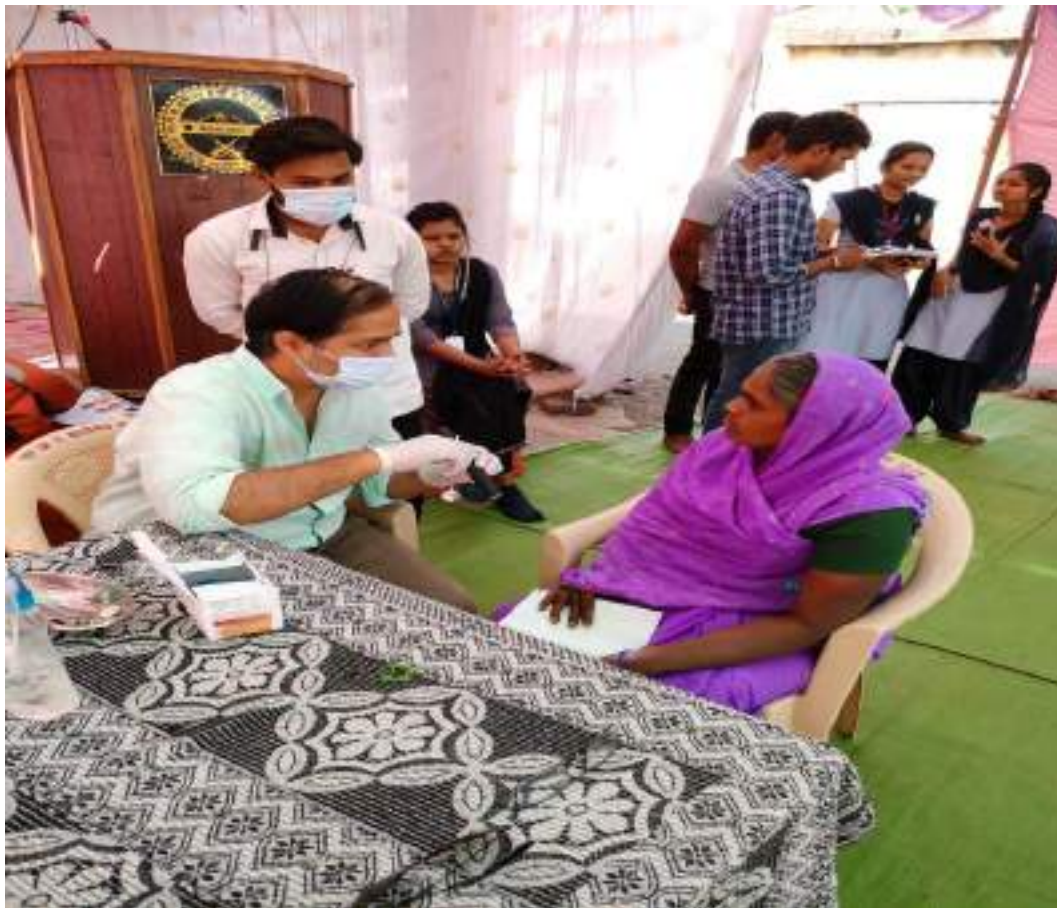
Photograph of Dental camp,date 01/02/2024