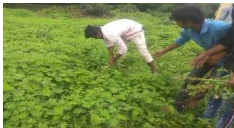
Photograph of Eradication of Parthenium, date 22/08/2021