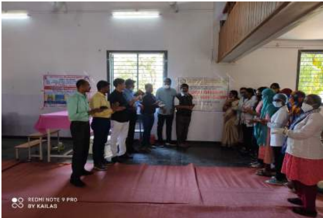
Photograph of Blood Donation Camp, date 29/09/2019