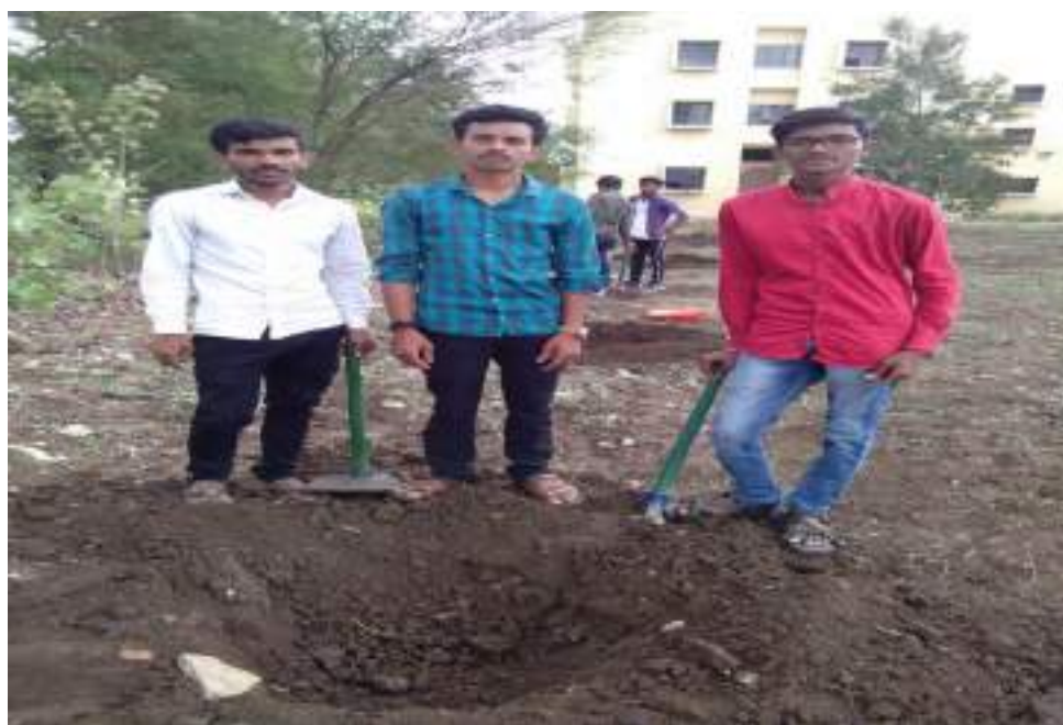
Photograph of Hostel Cleanliness, date 19/08/2019