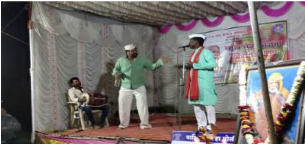
Photograph of Cultural program, date 04/02/2020