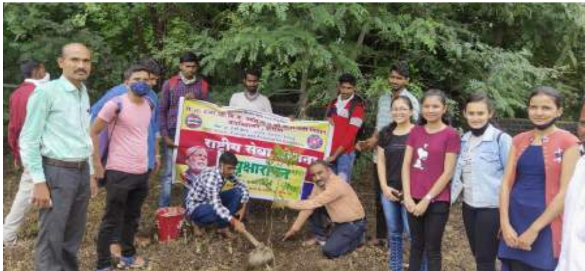
Photograph of Tree Plantation Program, date 10/08/2020