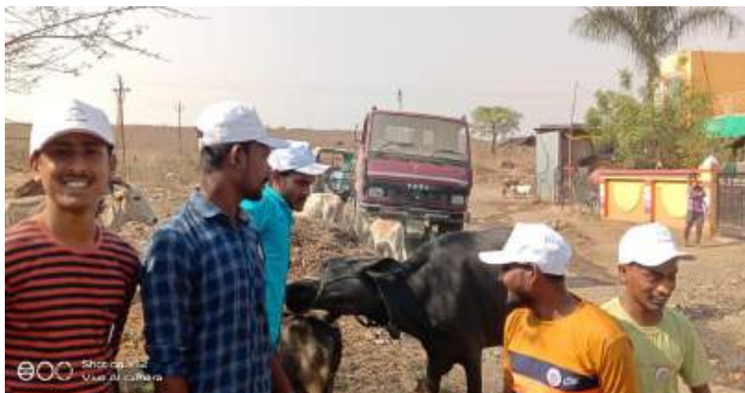
Photograph of Veterinary Diagnosis Camp, date 28/03/2022