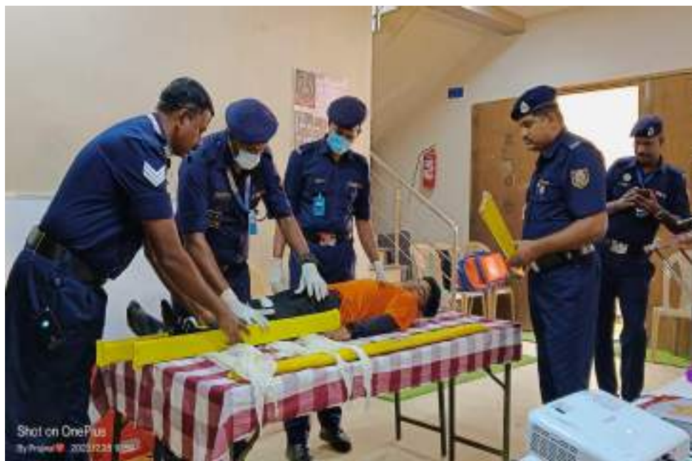
Photograph of Disaster management Workshop, date 25/12/2023