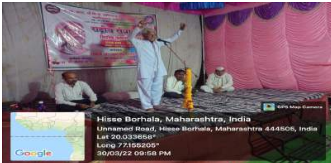
Photograph of Youth Dialogue skills, date 30/03/2022