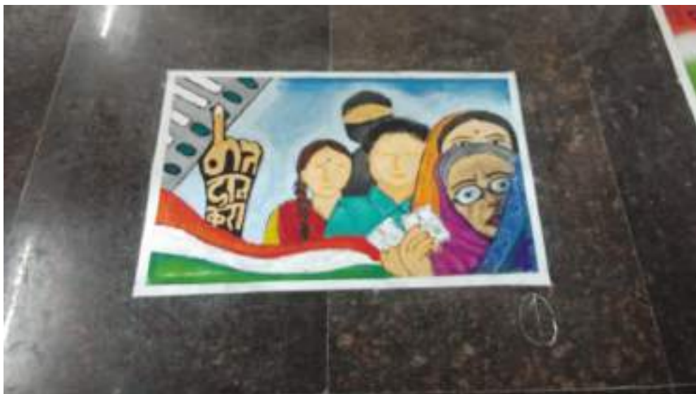
Photograph of National Voter's Day, date 25/01/2020