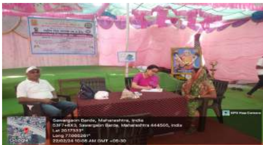
Photograph of Health Check-up Camp, 22/02/2024