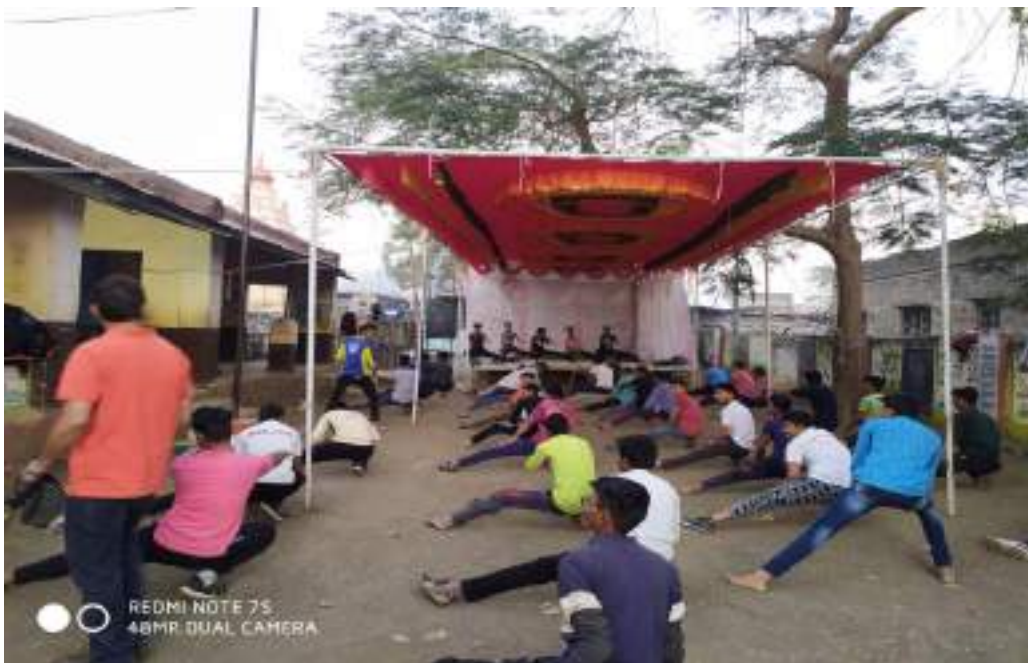
Photograph of Self-defense Karate Program, date 03/02/2020