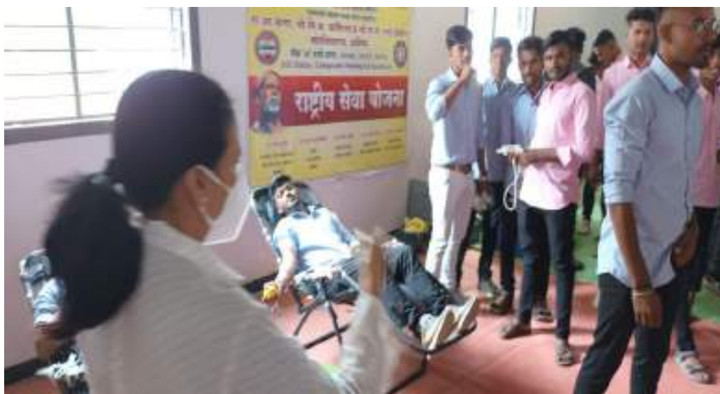
Photograph of Blood Donation of College students in the Camp, date 14/11/2022