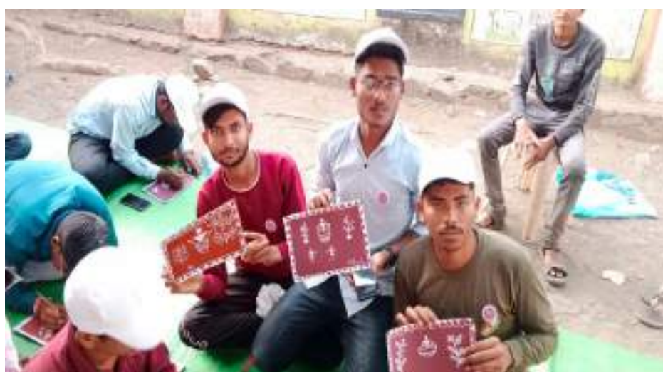
Photograph of Warli Art Workshop, date 27/03/2022