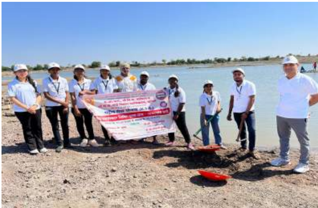
Photograph of Pond Deepening and Strengthening Project, date 21/02/2024