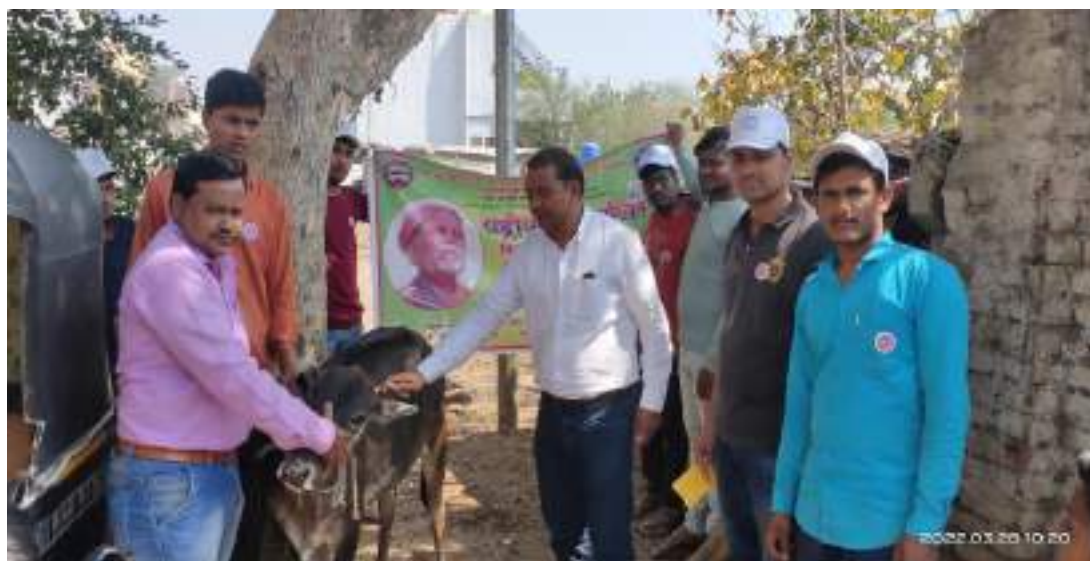
Photograph of Veterinary Diagnosis Camp, date 28/03/2022