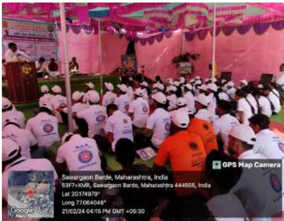
Photograph of Organic Farming Program, date 21/02/2024