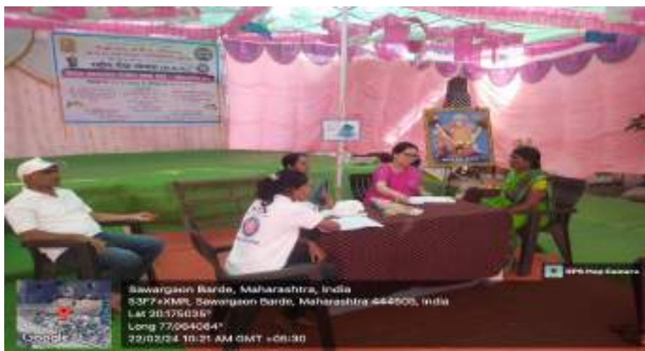
Photograph of Health Check-up Camp, 22/02/2024