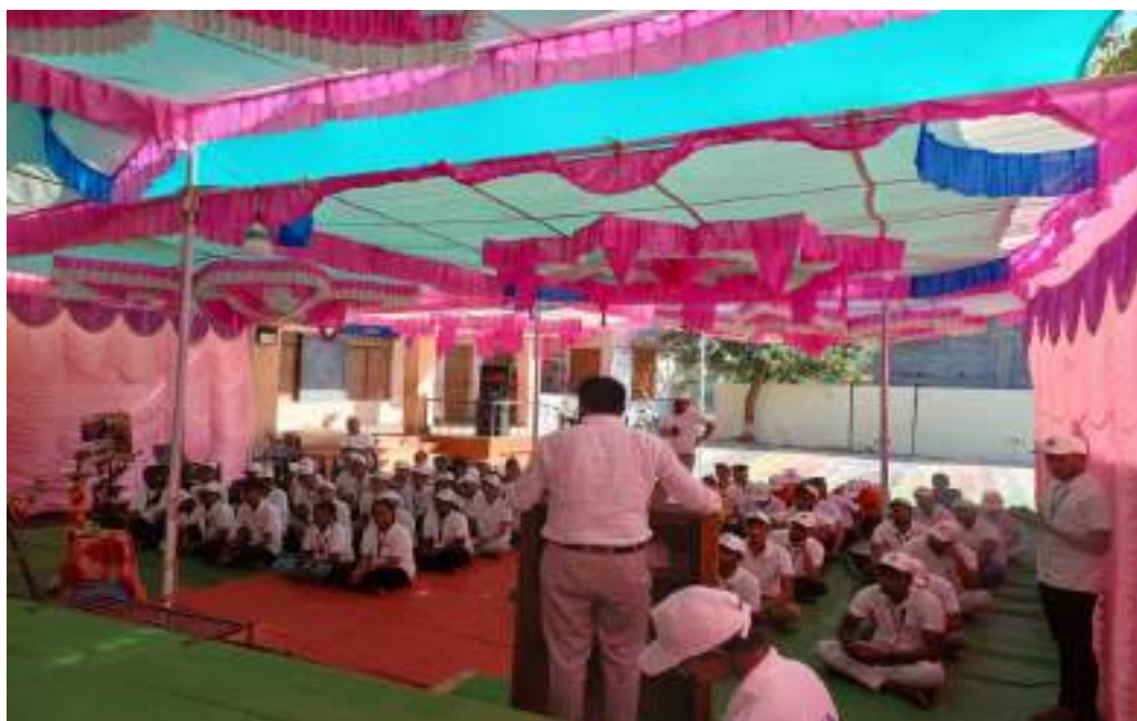
Photograph of Disaster Management Program, date 21/02/2024