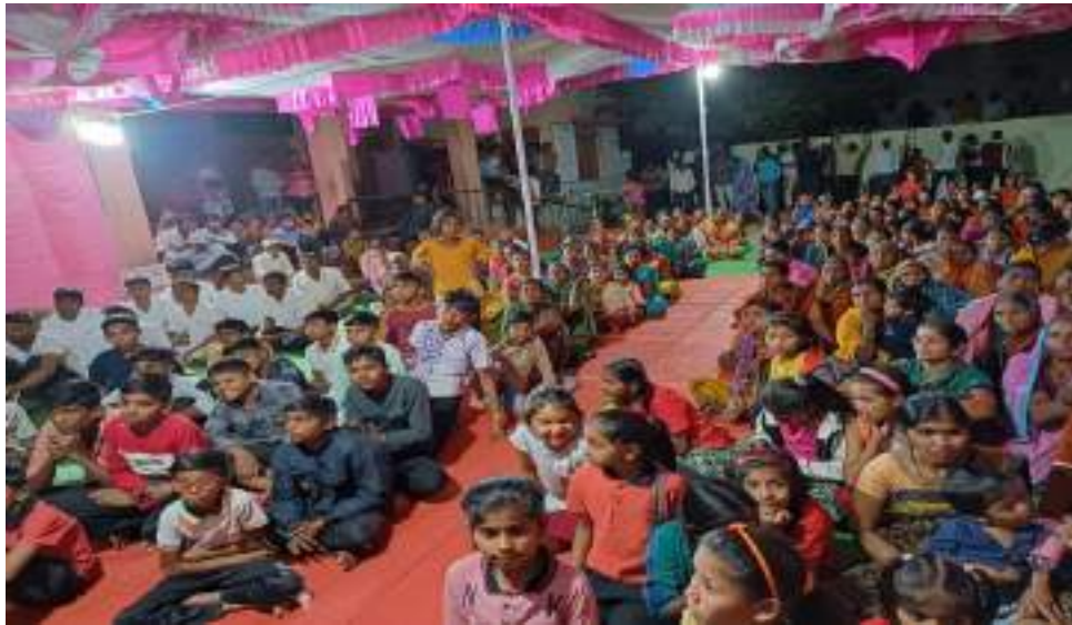
Photograph of Defecation Program, date 21/02/2024