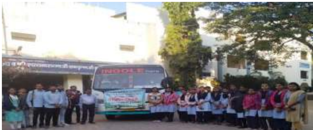
Photograph of Ready for tour/ visit (participant gathered in campus), date 25/01/2020