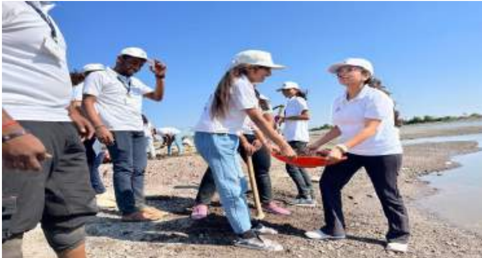
Photograph of Pond Deepening and Strengthening Project, date 21/02/2024