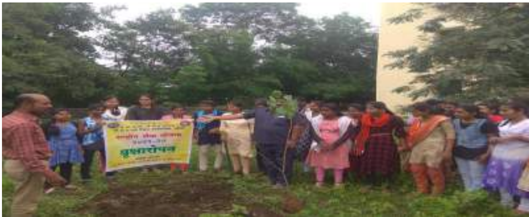
Photograph of Tree Plantation, date 14/08/2019