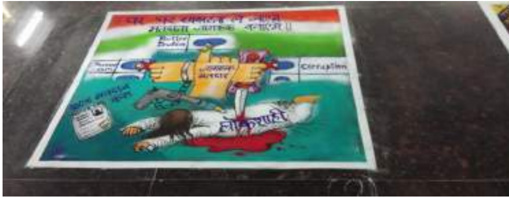
Photograph of National Voter's Day, date 25/01/2020