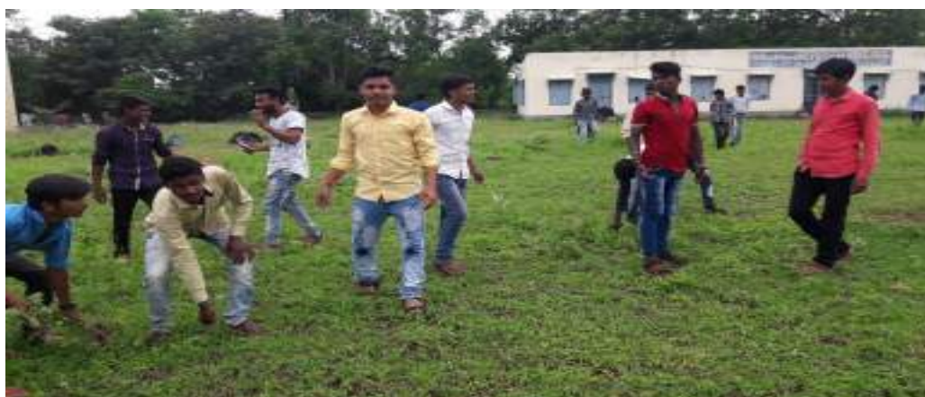
Photograph of Parthenium Hysterophorus, date 13/08/2019