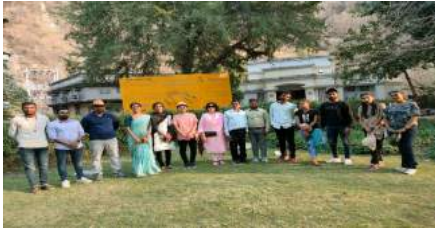
Photograph of Ajantha Caves, date 26/03/2024