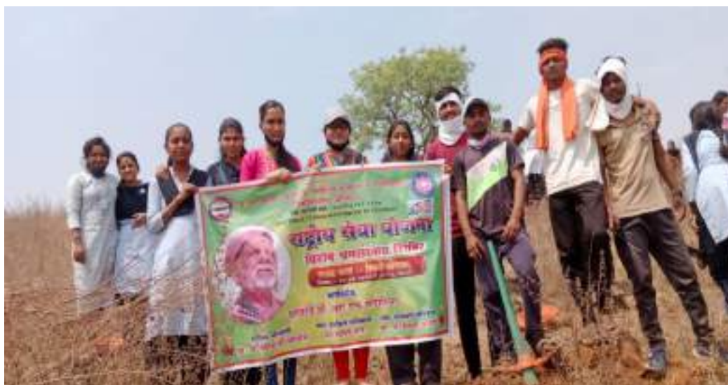
Photograph of Students Engage in Voluntary labor, date 28/03/2022