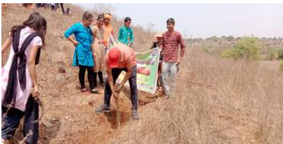
Photograph of Students Engage in Voluntary labor, date 28/03/2022