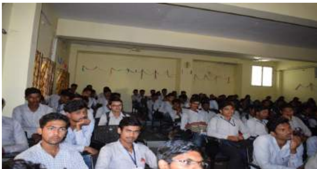
Photograph of Disaster Relief Day, date 13/10/ 2019