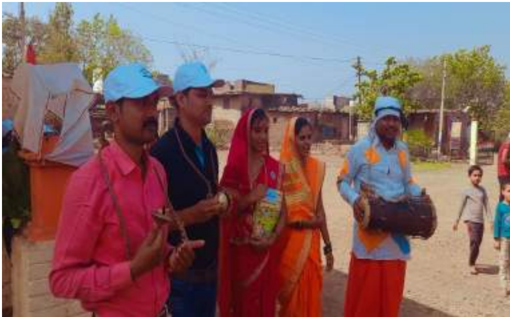
Photograph of clean-up drive, date 30/03/2022