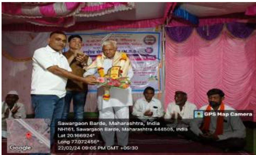
Photograph of Defecation Program, date 21/02/2024