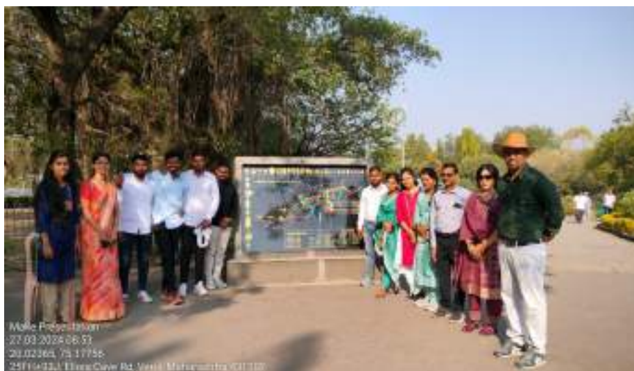
Photograph of Ellora Caves, date 27/03/2024