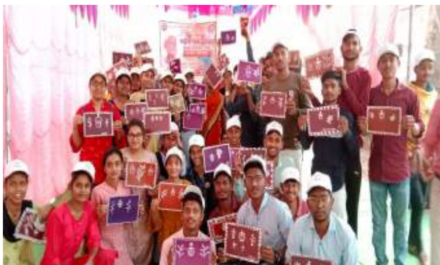
Photograph of Warli Art Workshop, date 27/03/2022