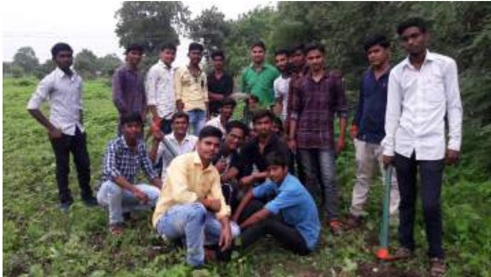
Photograph of Hostel Cleanliness, date 19/08/2019