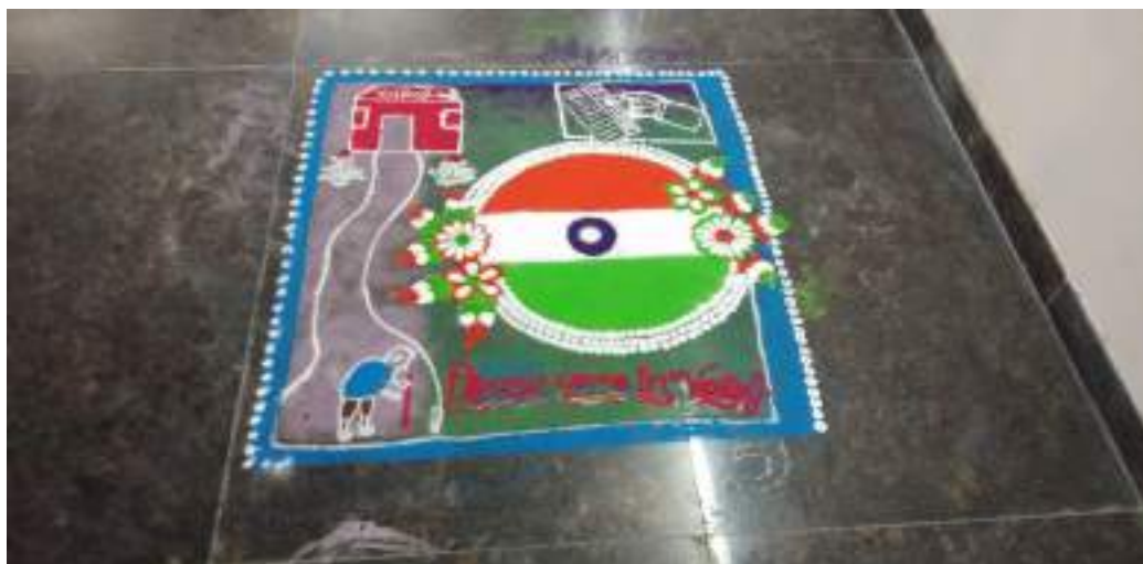
Photograph of National Voter's Day, date 25/01/2020