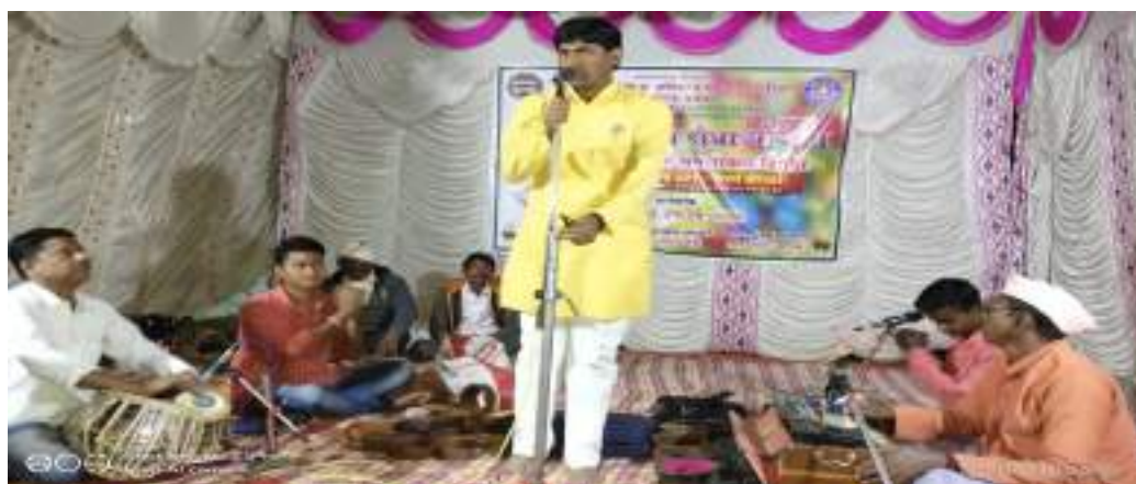
Photographs of Village open defecation free On Monday, 03/02/,2020