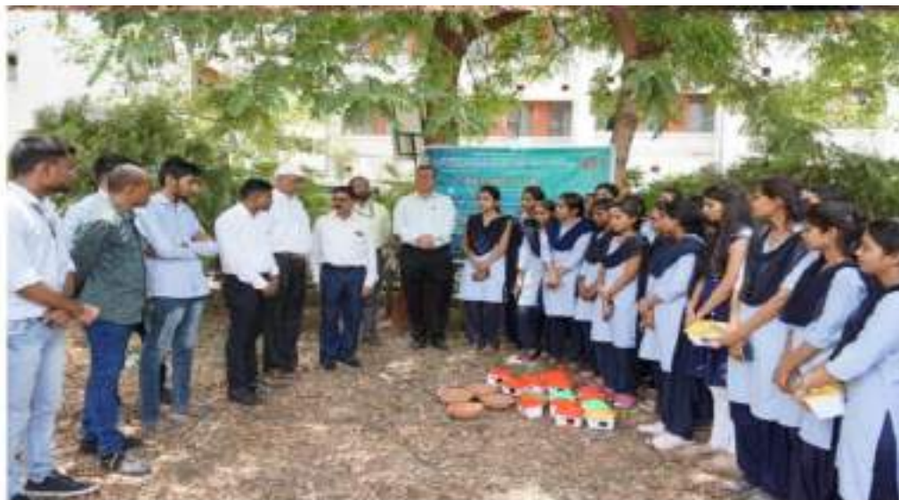
Photograph of Installation of Nests and Water Pots for Bird