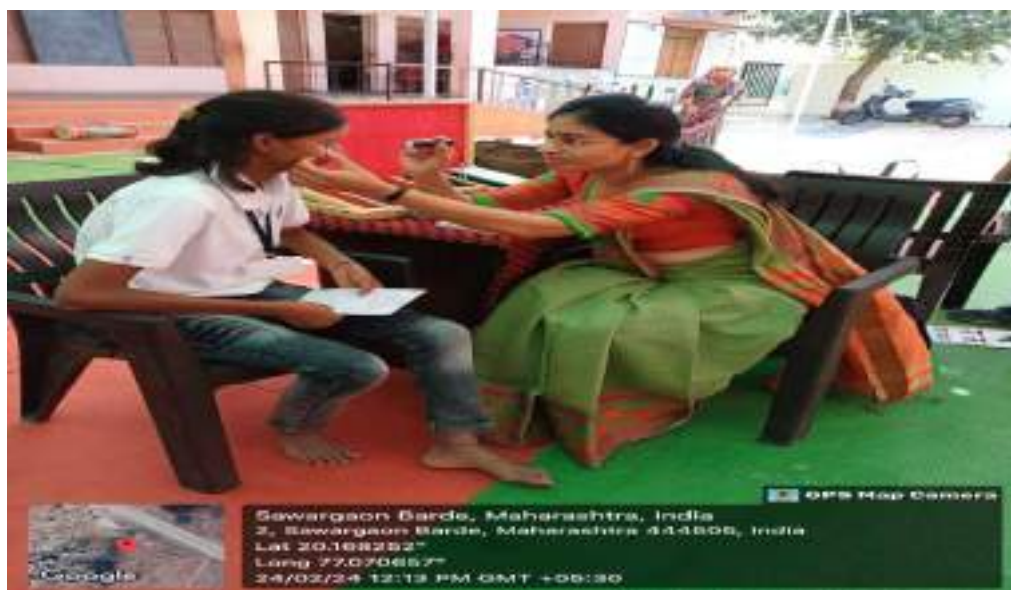
Photograph of Eye-check camp, date 24/02/2024