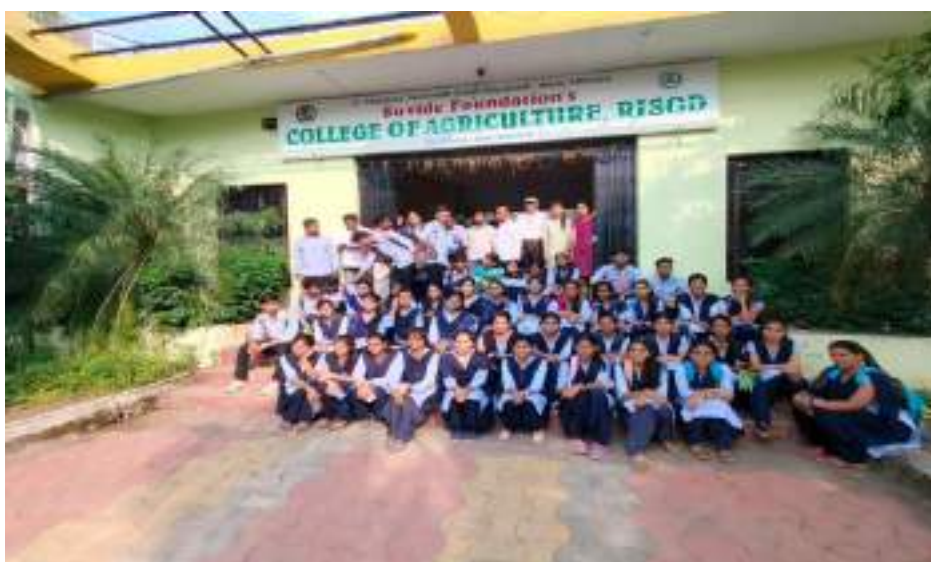
Photograph of KVK Karada Field Visit Program, date 19/10/2023