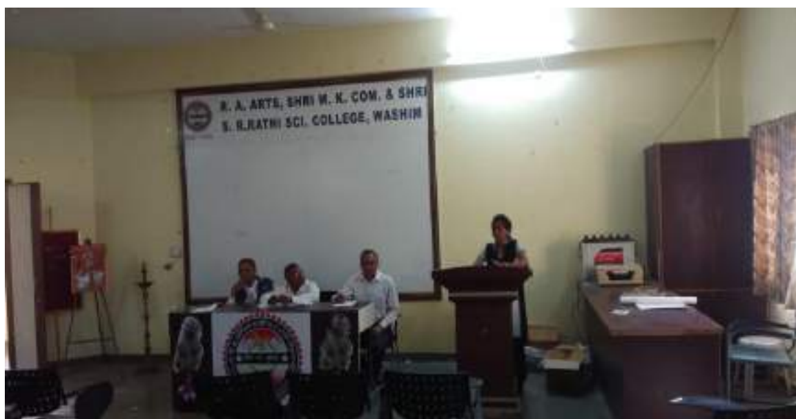
Photograph of National Voter's Day, date 25/01/2020