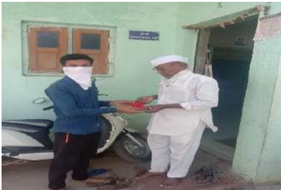
Photograph of Distribution of mask and sanitizer