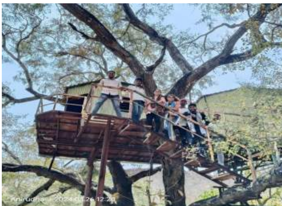
Photographs of Dnyanganga Wildlife Sanctuary, date 26/03/2024