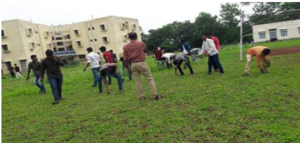
Photograph of Parthenium Hysterophorus, date 13/08/2019