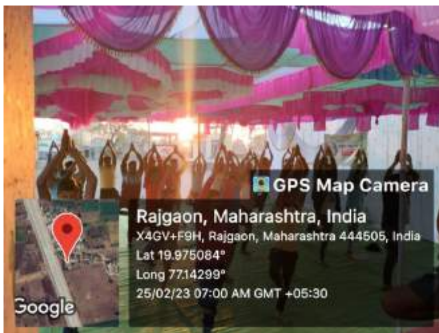
Photograph of Program on Yogasan, date 25/02/2023