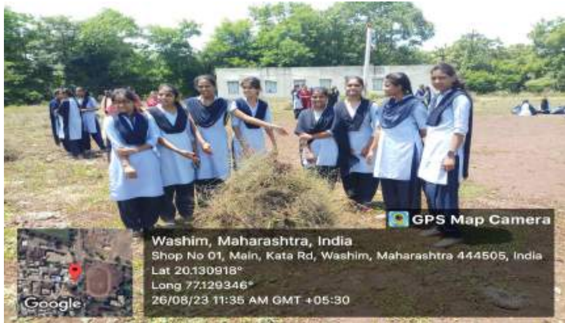
Photograph of Students Participation in the Eradication of Carrot Grass, date 26/08/2023