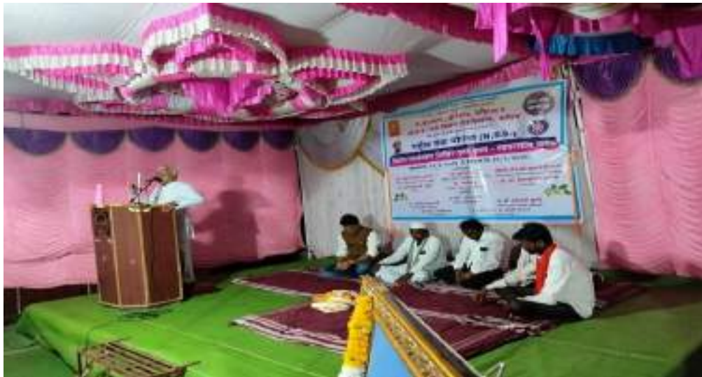
Photograph of Defecation Program, date 21/02/2024