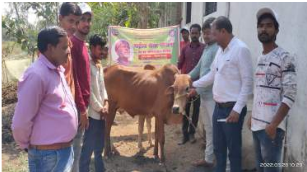
Photograph of Veterinary Diagnosis Camp, date 28/03/2022