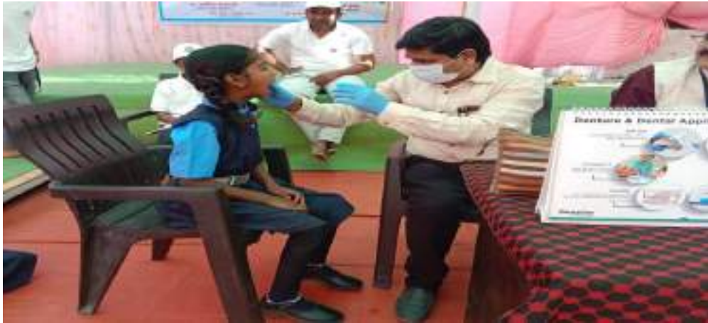
Photograph of Dental Camp, date 21/02/2024