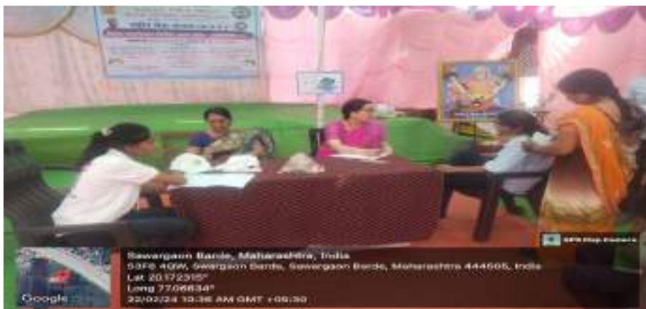
Photograph of Health Check-up Camp, 22/02/2024