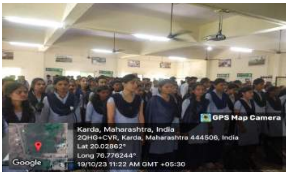
Photograph of KVK Karda Field Visit Program, date 19/10/2023