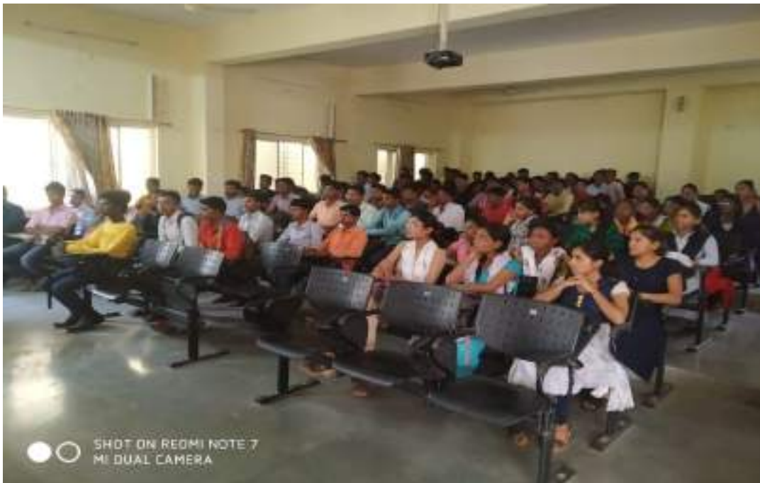
Photograph of Tobacco Adiction Program, dated 19/7/2019