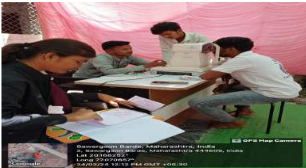
Photograph of Eye-check camp, date 24/02/2024