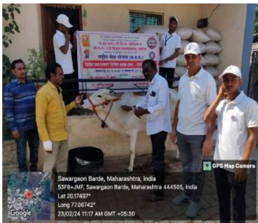
Photograph of Veterinary Diagnosis Camp, date 23/02/2024