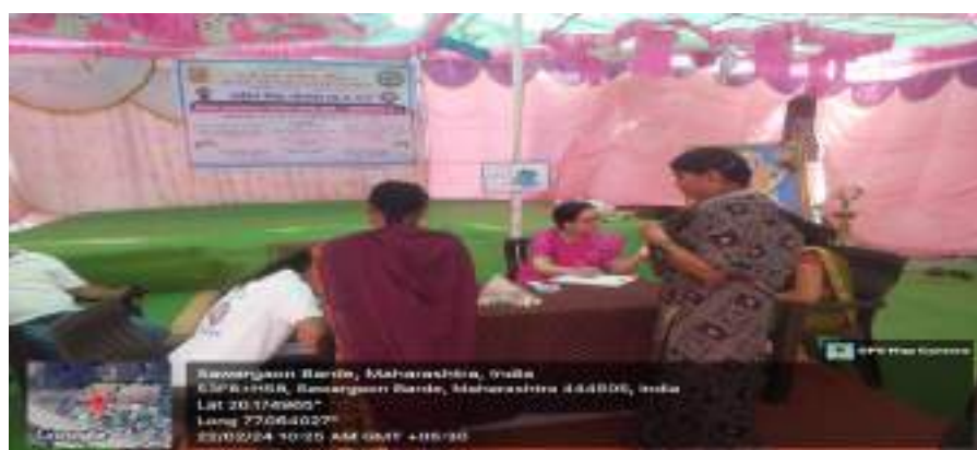
Photograph of Health Check-up Camp, 22/02/2024