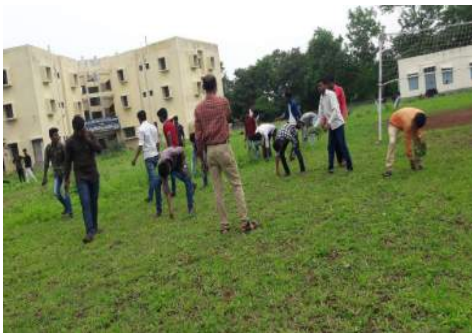
Photograph of Parthenium eradication, date 20/08/2021