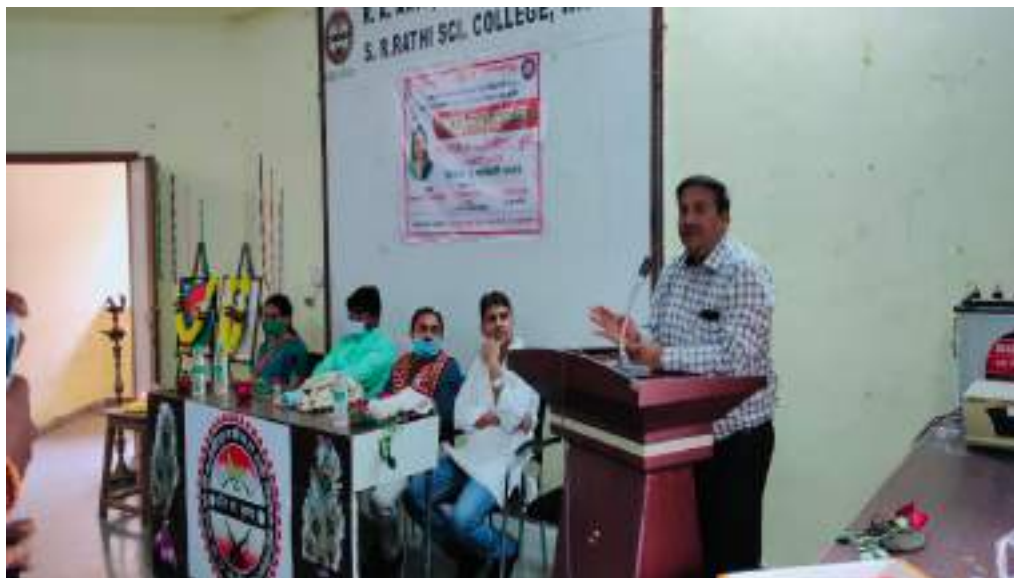
Photograph of Corona Epidemic Awareness, date 20/05/2020