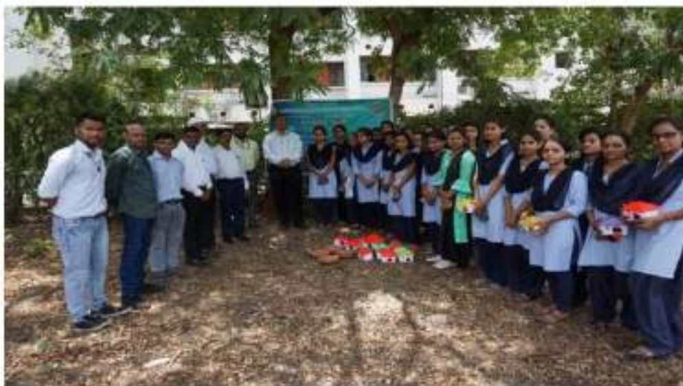
Photograph of the Additional Collector Guide students