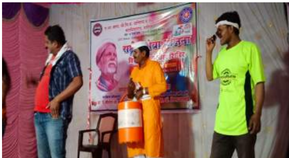
Photograph of Eradication of Supersition, date 28/03/2022