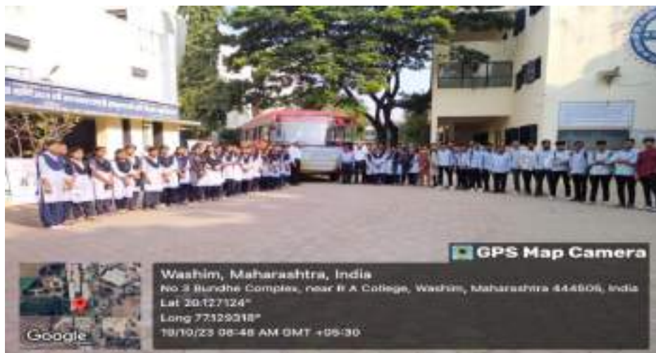
Photograph of KVK Karada Field Visit Program, date 19/10/2023