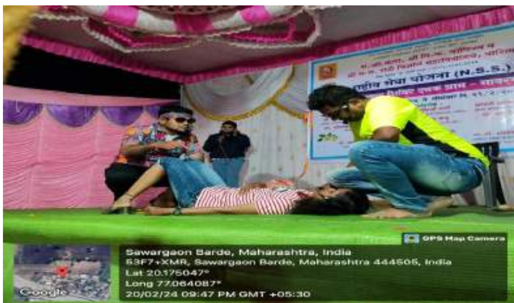
Photograph of Cultural Program 'Nirbhaya Lagali Ludhayala', date 20/02/2024