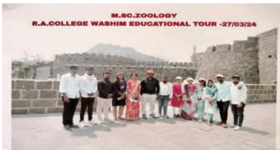
Photograph of Daulatabad Fort, date 27/03/2024