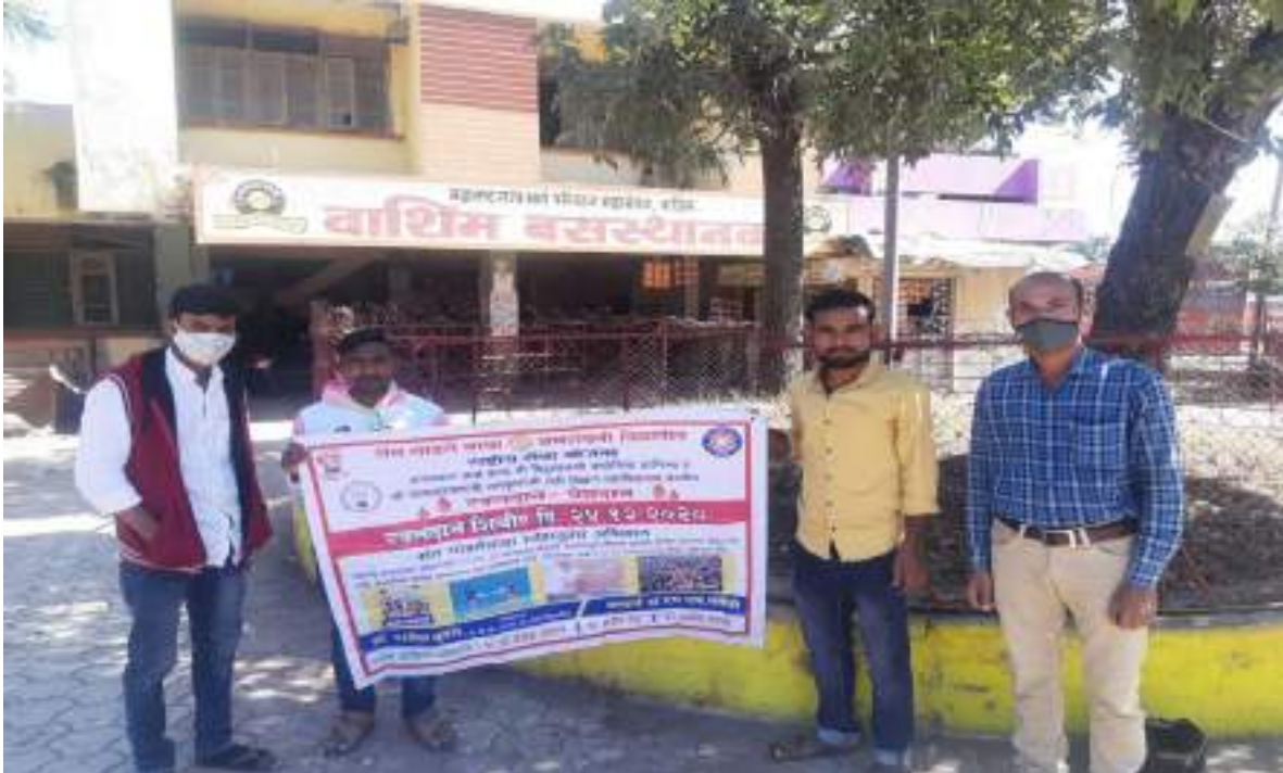
Photograph of Blood Donation camp, date 24/11/2020