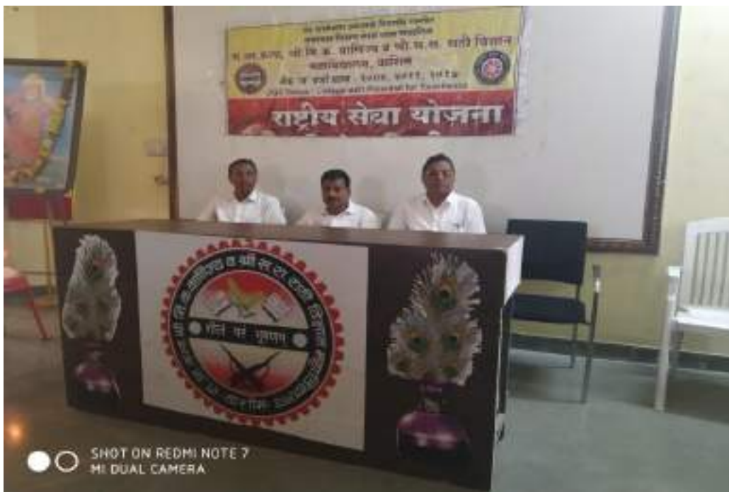
Photograph of Tobacco Adiction Program, dated 19/7/2019