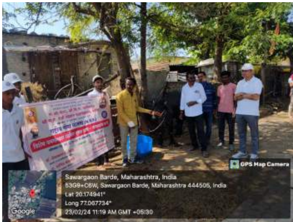
Photograph of Veterinary Diagnosis Camp, date 23/02/2024