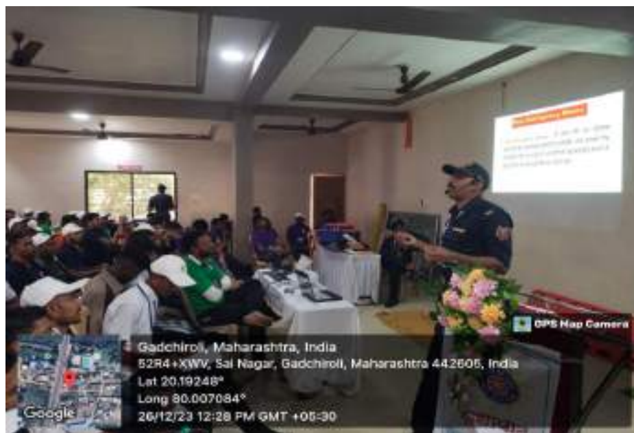
Photograph of Disaster management Workshop, date 25/12/2023