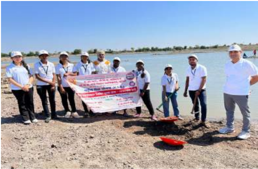
Photograph of Pond Deepening and Strengthening Project, date 21/02/2024