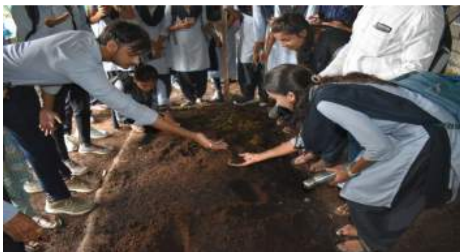
Photograph of KVK Karda Field Visit Program, date 19/10/2023