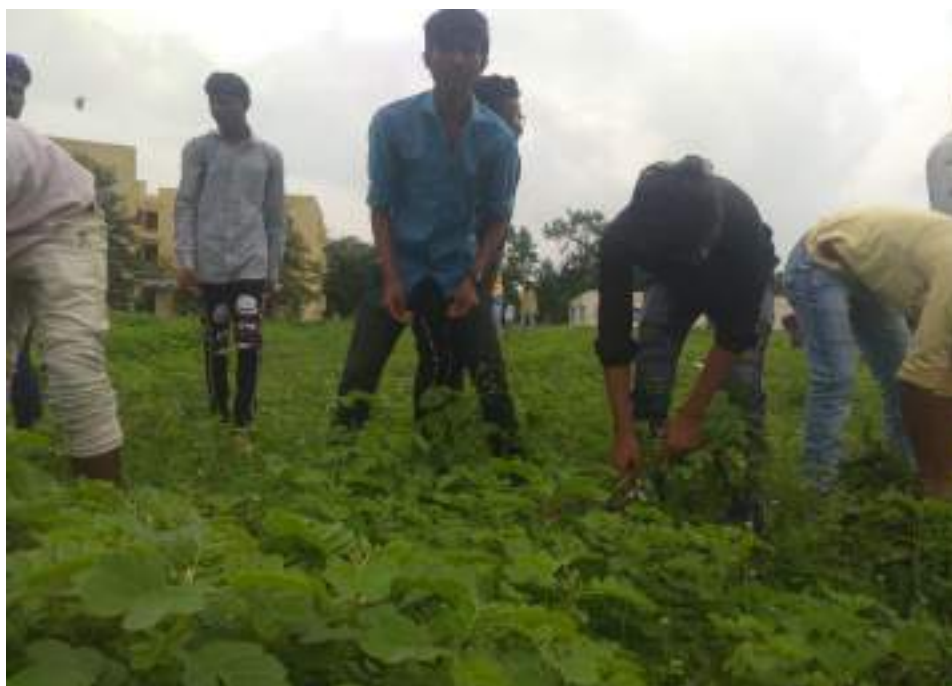
Photograph of Parthenium eradication, date 20/08/2021