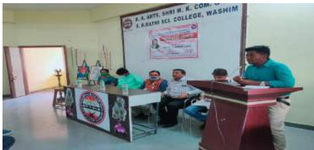
Photograph of Corona Epidemic Awareness, date 20/05/2020