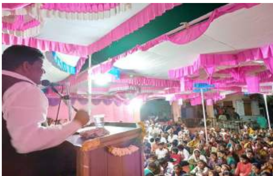
Photograph of Organic Farming Program, date 21/02/2024