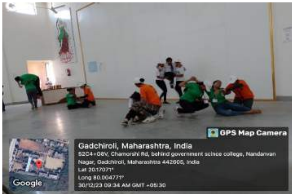
Photograph of Disaster management Workshop, date 25/12/2023