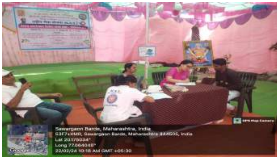
Photograph of Health Check-up Camp, 22/02/2024