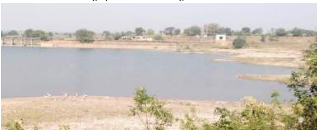
Photograph of Ekburji reservoir site of migratory bird, date 25/01/2020