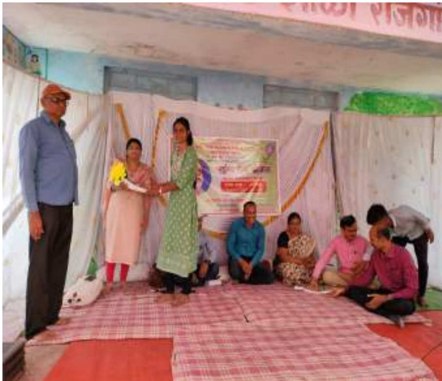
Photograph of Inauguration of Pediatrics and Gynecology Diagnosis Camp, date 01/03/2023