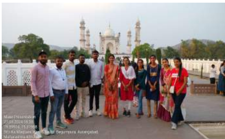
Photograph of Bibi Ka Maqbara, date 27/03/2024