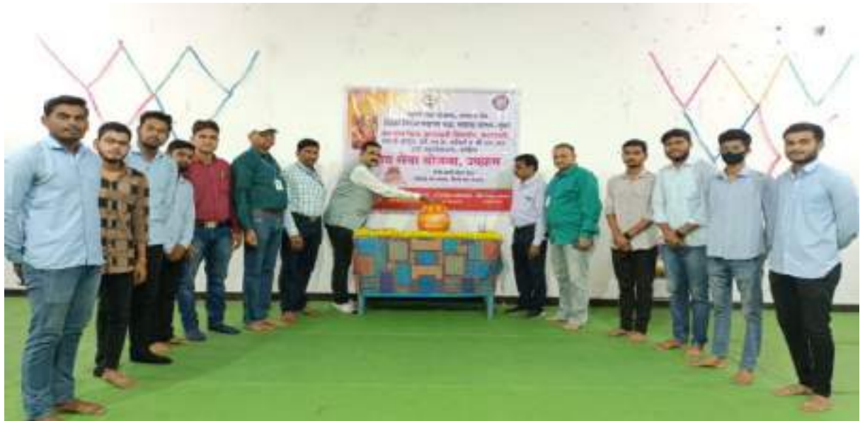
Photograph of Participation of Principal of the college, Teachers and students, date 09/08/2023