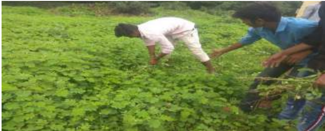
Photograph of Parthenium Hysterophorus, date 13/08/2019