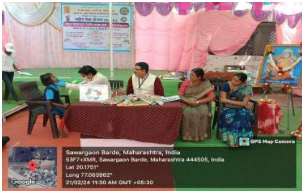
Photograph of Dental Camp, date 21/02/2024