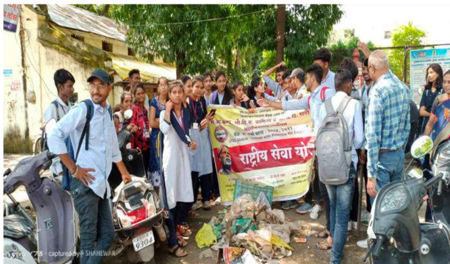
Photograph of Plastic-Free India Campaign, date 15/10/2022