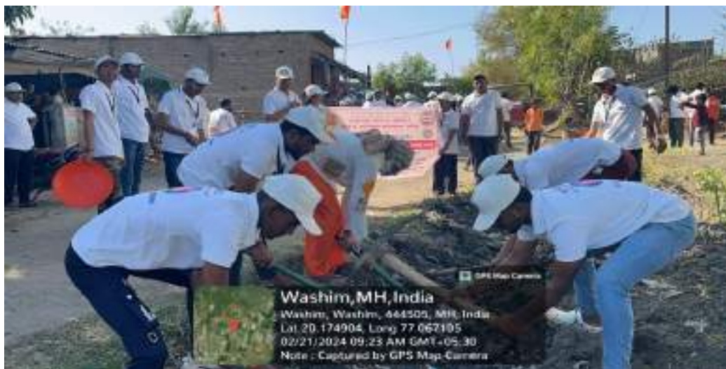
Photograph of Village Cleanliness Program, date 21/02/2024