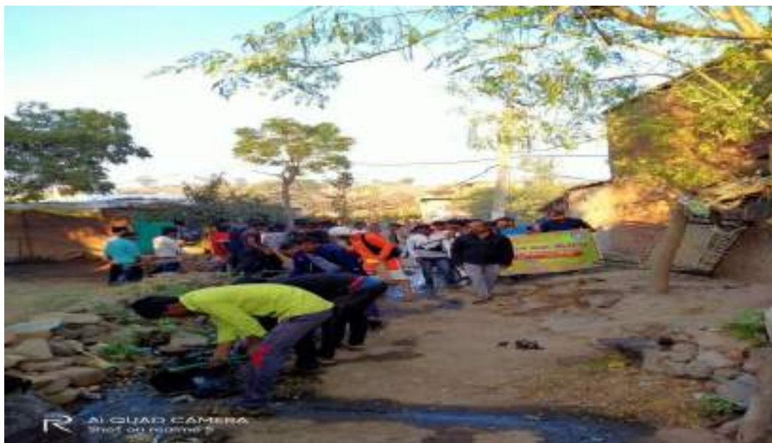
Photograph of Cleaning and drainage camp,date 31/01/ 2020