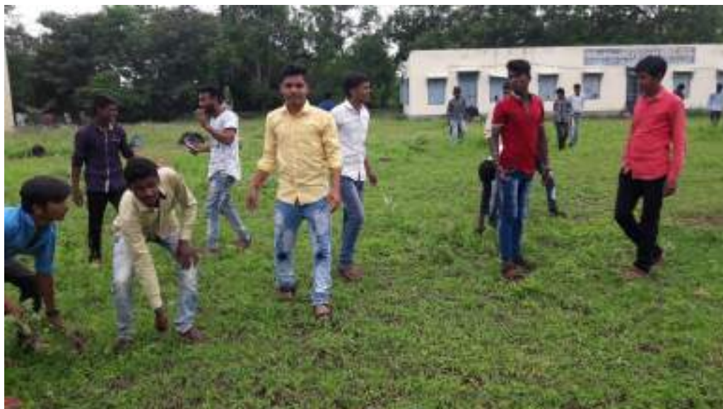
Photograph of Hostel Cleanliness, date 19/08/2019