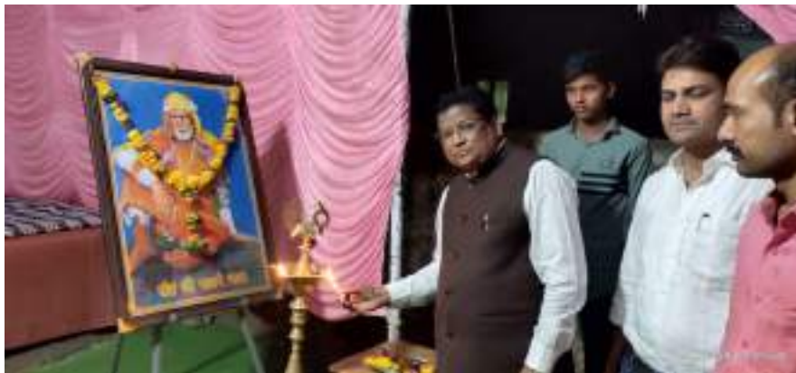
Photograph of Eradicating Superstition, date 30/03/2022