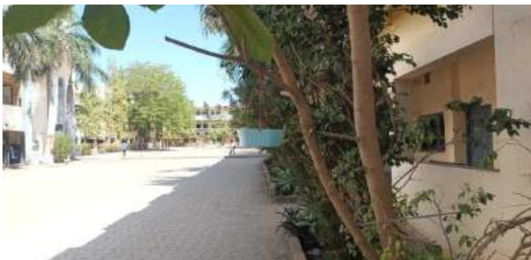
Photograph of Installation of Nests and Water Pots for Bird