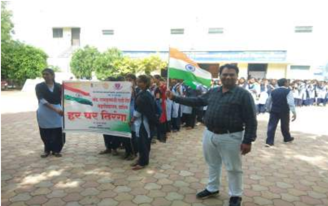
Photograph of vaccination Drive, date 25/10/2021