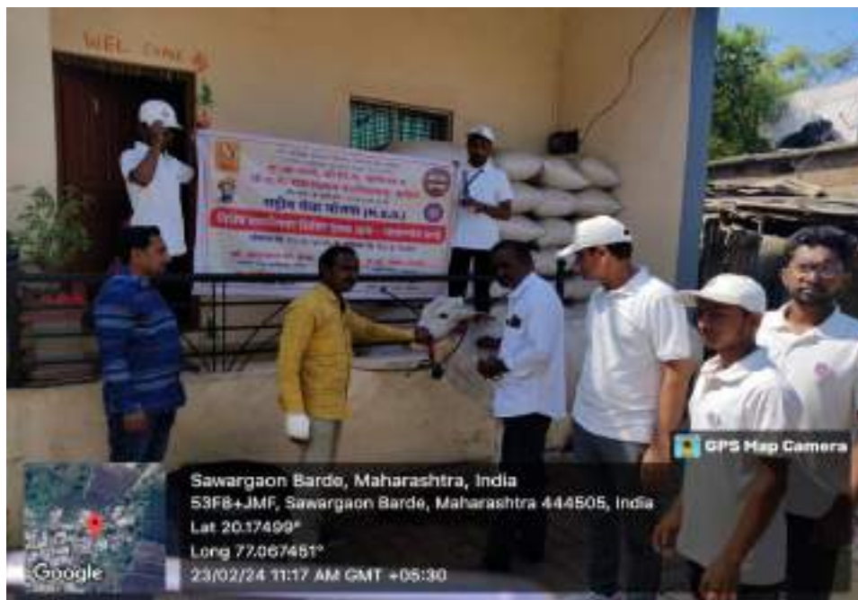
Photograph of Veterinary Diagnosis Camp, date 23/02/2024