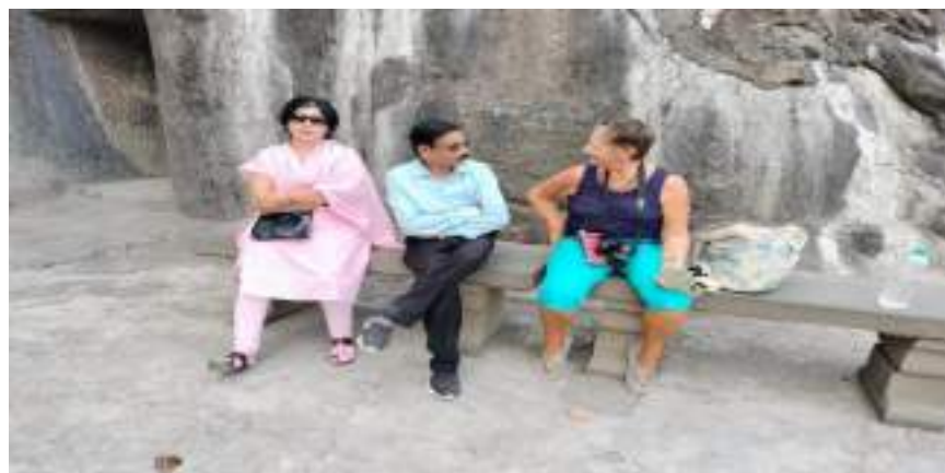
Photograph of Ajantha Caves, date 26/03/2024