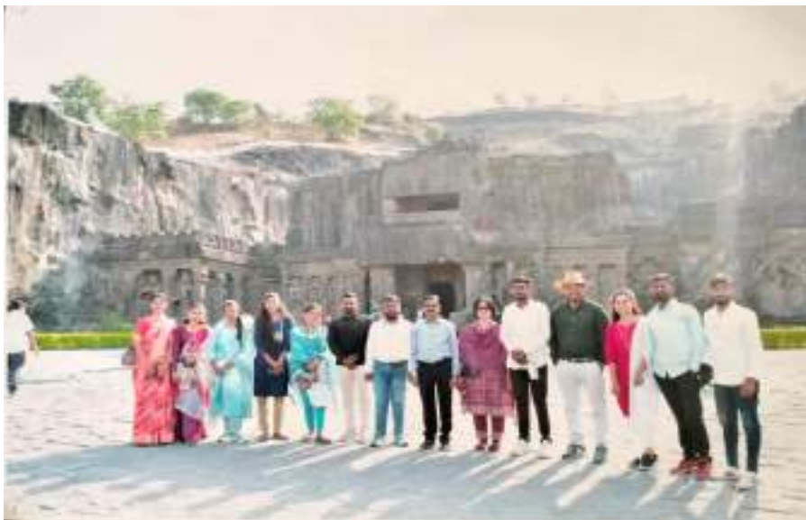
Photograph of Ellora Caves, date 27/03/2024