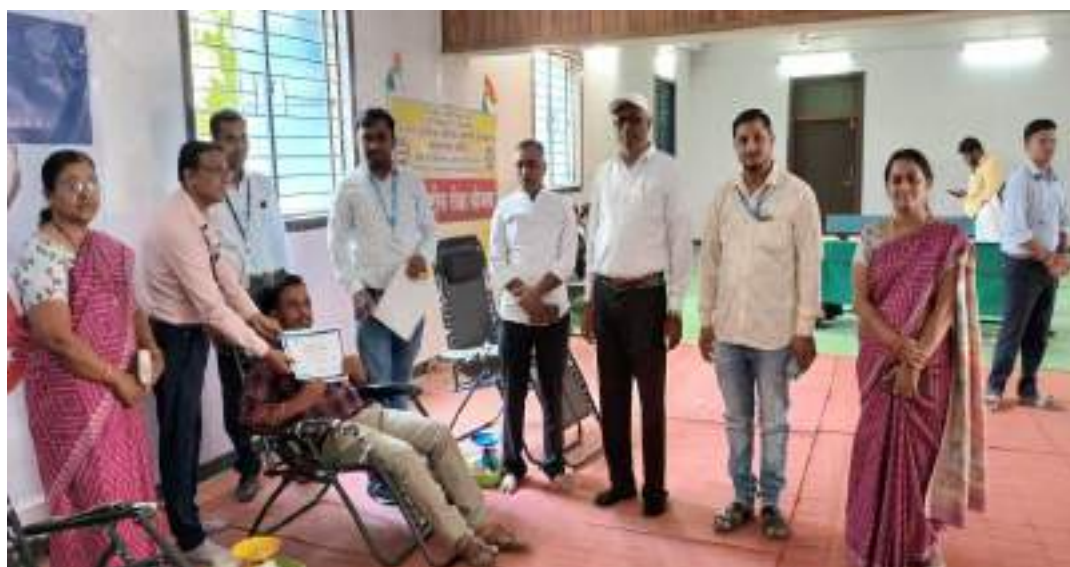
Photograph of Blood Donation of College students in the Camp, date 14/11/2022