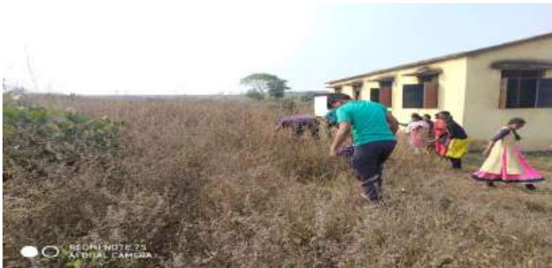
Photograph of Cleaning and drainage camp,date 31/01/ 2020