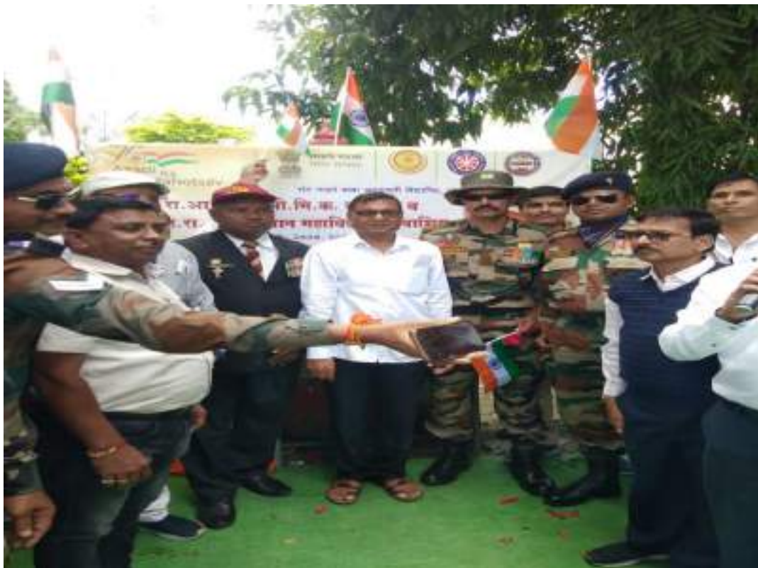
Photograph of vaccination Drive, date 25/10/2021