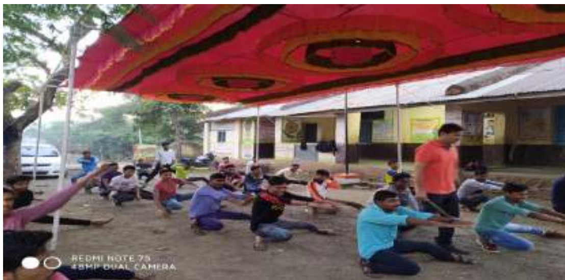
Photograph of Self-defense Karate Program, date 03/02/2020