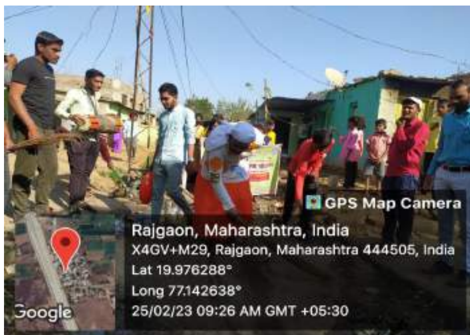
Photograph of Gram Swachata Abhiyan, date 25/02/2023