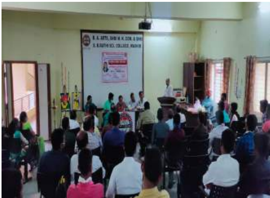
Photograph of Corona Epidemic Awareness, date 20/05/2020