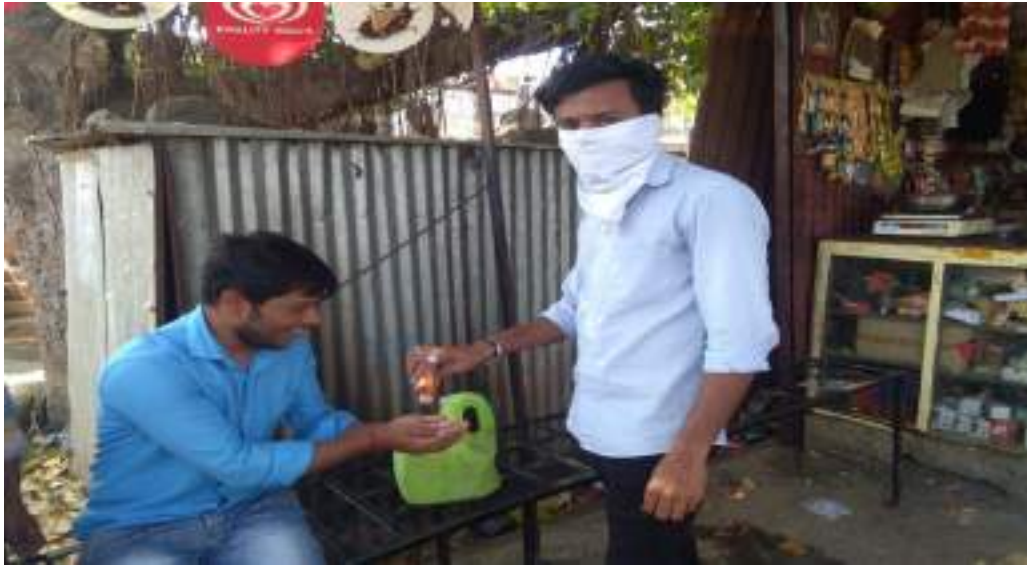
Photograph of Corona Epidemic Awareness, date 20/05/2020