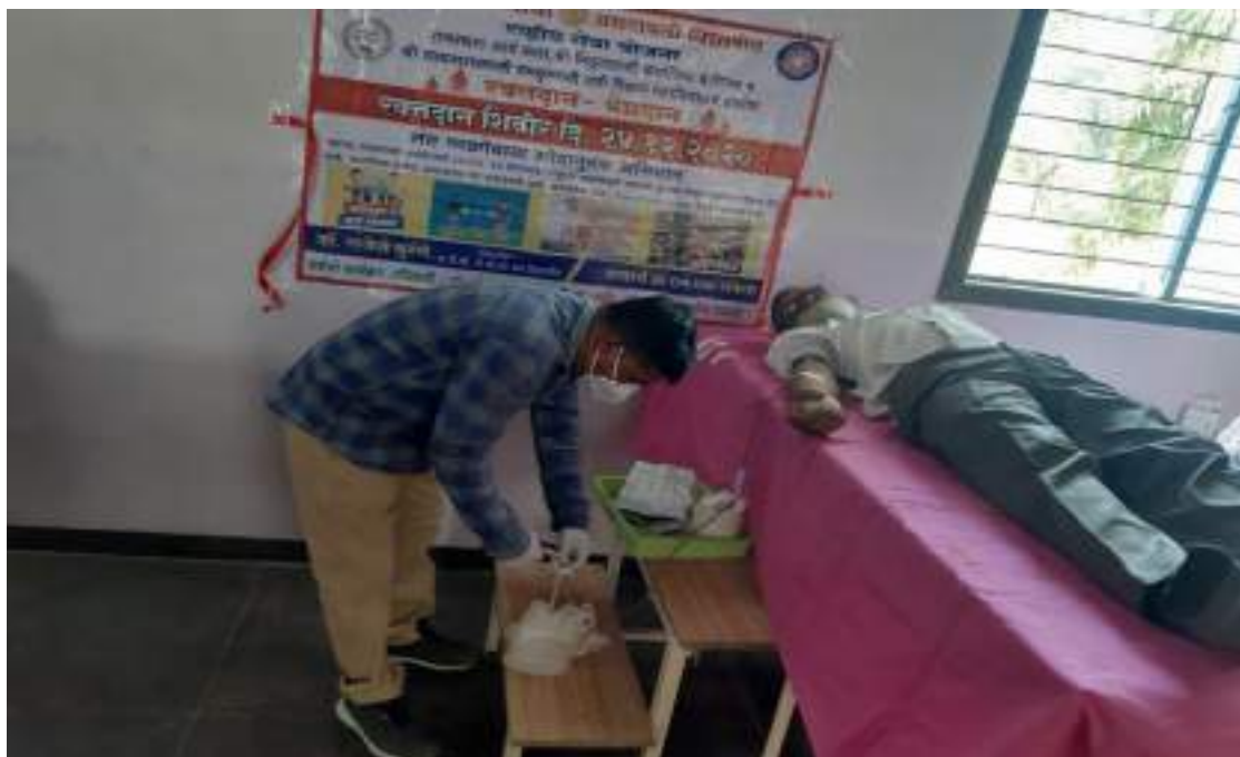
Photograph of Blood Donation camp, date 24/11/2020