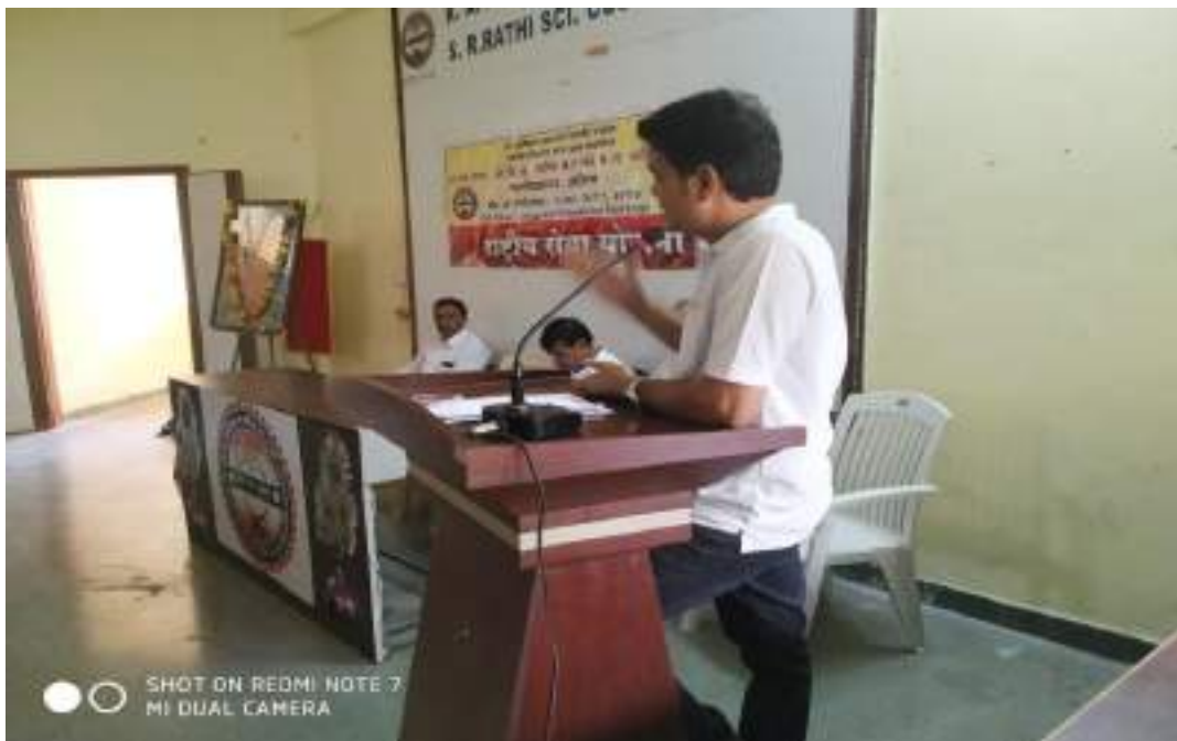
Photograph of Tobacco Adiction Program, dated 19/7/2019