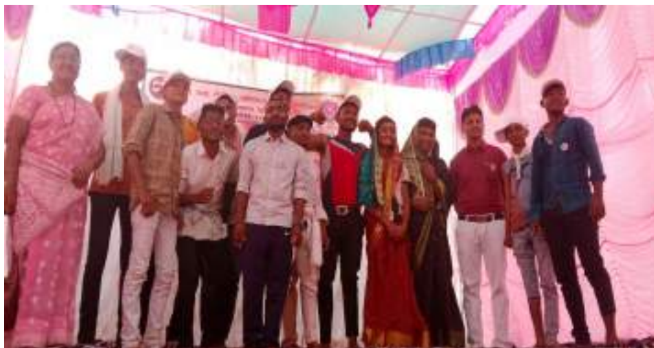
Photograph of Eradicating Superstition, date 30/03/2022