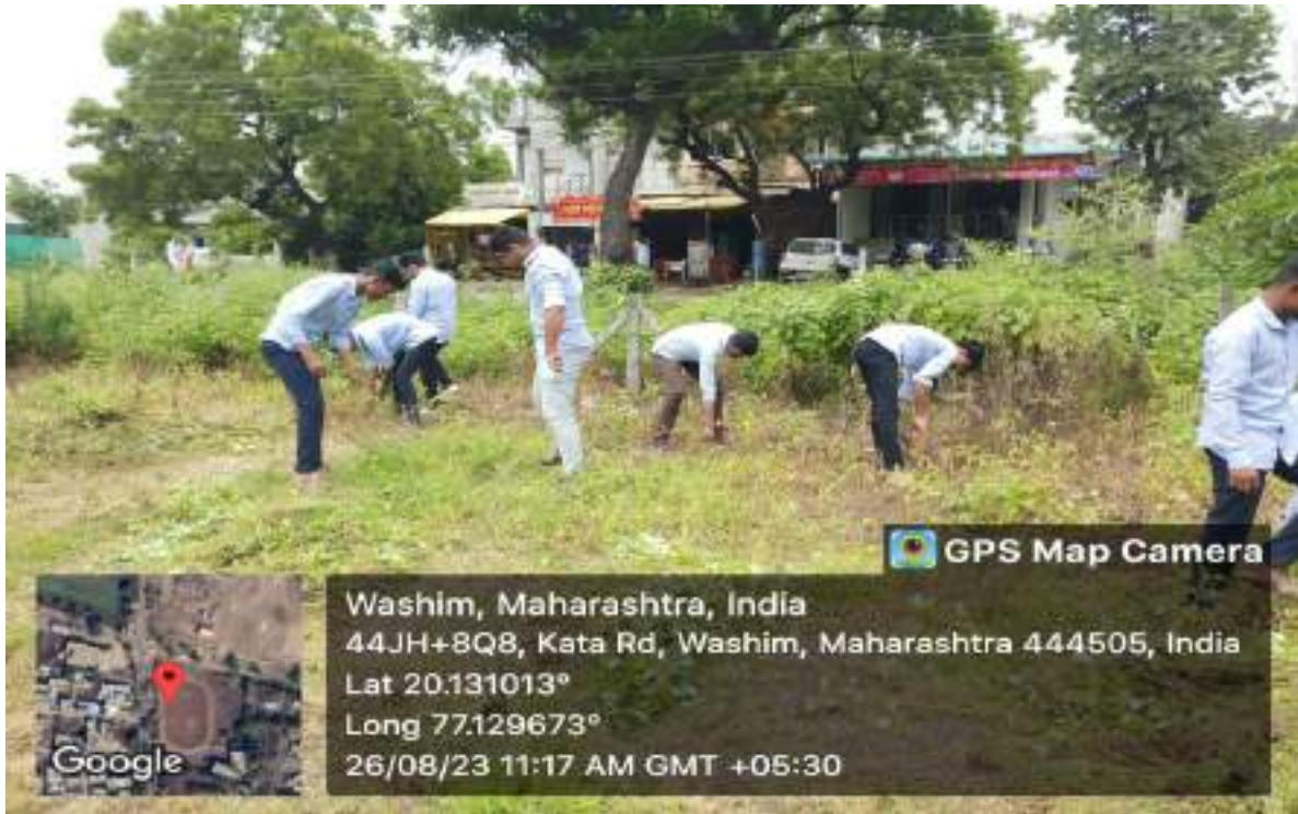
Photograph of Students Participation in the Eradication of Carrot Grass, date 26/08/2023