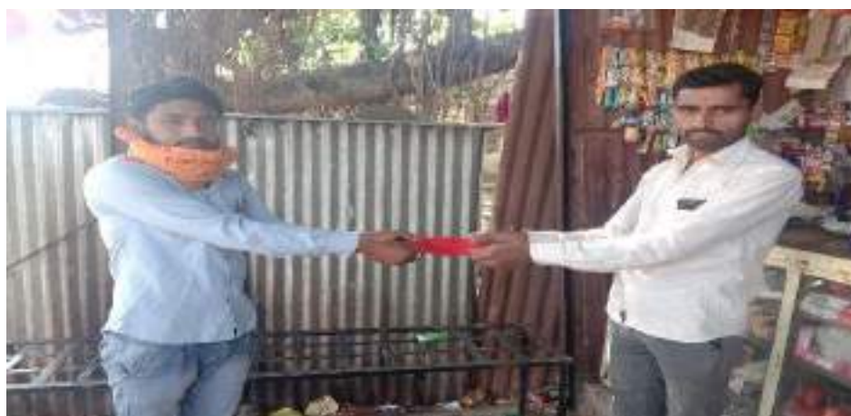
Photograph of Distribution of mask and sanitizer