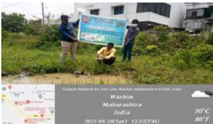
Photograph of Release of Guppy Fishes in the ponds near the Collector's Office, date 28/08/2021