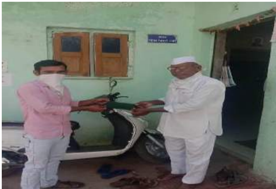
Photograph of Distribution of mask and sanitizer