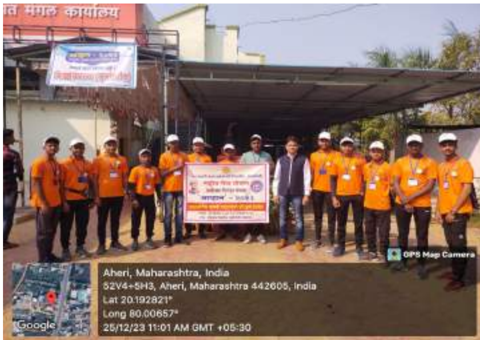
Photograph of Disaster management Workshop, date 25/12/2023