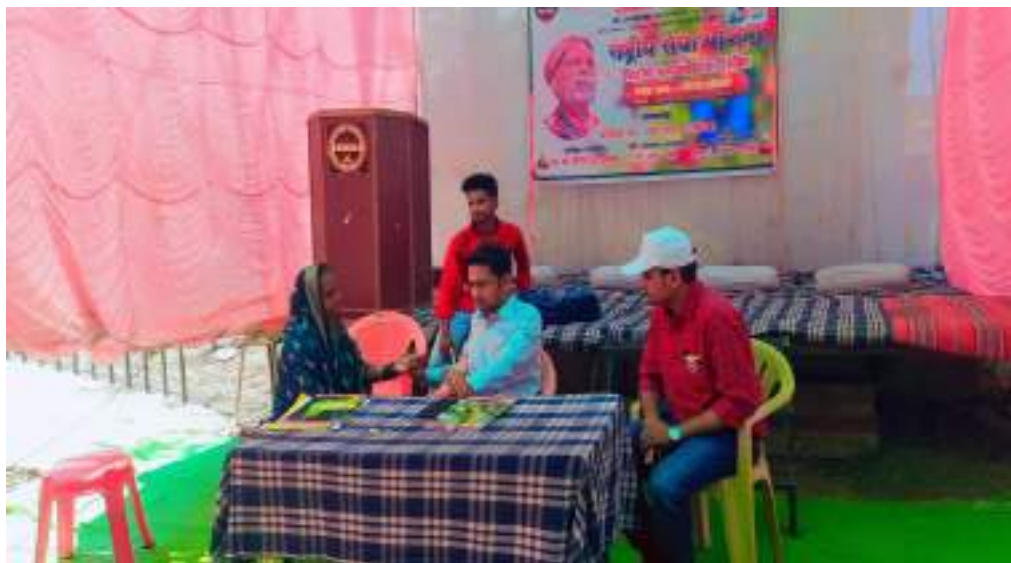
Photograph of Health checkup Camp, date 25/03/2022