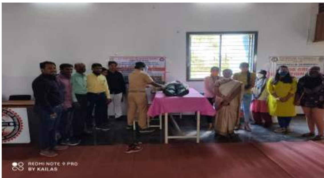
Photograph of Blood Donation camp, date 24/11/2020